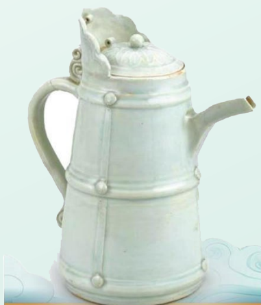
▼元代青白釉多穆壶。

“没有什么是一杯奶茶解决不了的”,从古代的多穆壶到现在风格多样的奶茶杯,器具在变,但“食器亦雅器”的生活美学历久弥新。年轻人在博物馆里打卡古人的“奶茶壶”,透过器具想象背后的历史生活、烟火日常,情感共鸣油然而生。那一刻,厚重的历史便多了几分亲切感,令人回味无穷。