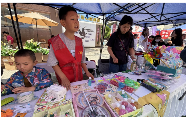
近日,沙坡头区瑞丰社区联合中卫市职业技术学校,开展“技能践初心 服务暖邻里”便民志愿服务。

在家长的陪伴下,孩子们走进非遗街区,参观特色非遗工坊,动手体验剪纸、贺兰砚雕刻等传统技艺,近距离感受非遗的独特魅力。社工引导孩子们拿起画笔,描绘一天的所见所感。此次活动将家风建设、亲子陪伴与民族团结教育深度融合,在行走研学中传承文化血脉,在温情相伴中涵养家国情怀,以良好家风筑牢民族团结根基。贺兰县妇联将继续发挥引领作用,聚焦儿童成长需求,深耕家庭教育与非遗传承融合之路,开展更多形式多样、内容丰富的家庭关爱和传承活动,用温情守护童心,用陪伴助力成长,让中华优秀传统文化代代相传,让良好家风浸润每一个家庭。