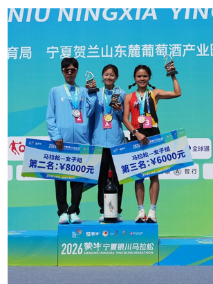
▲马拉松女子组冠、亚、季军合影留念。