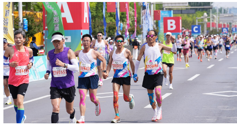
参赛选手顺利完赛。