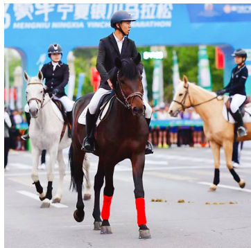
▲马术表演为银马助威。

5月17日7时,2026蒙牛宁夏银川马拉松在银川市人民广场西街激情开跑。来自区内外的2.5万名参赛选手(其中区外选手1.86万人)齐聚“塞上湖城 大美银川”,在赛道中挥洒汗水,共同见证了一场体育竞技与城市魅力交相辉映的奔跑盛宴。