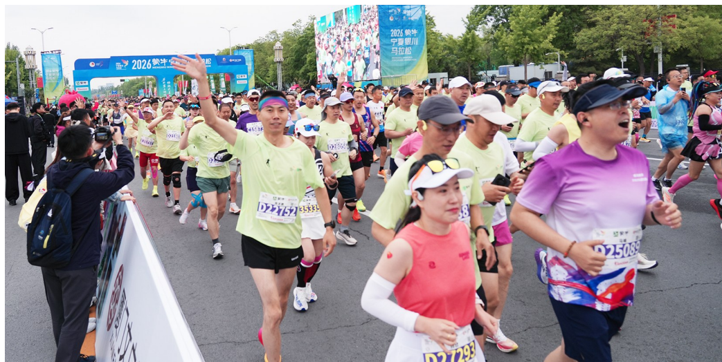
参赛选手相继冲出起点线。