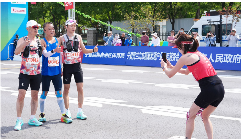
配速员与参赛选手合影留念。