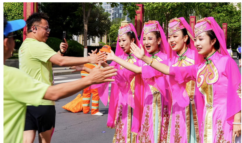
赛道上,民俗表演者为参赛选手加油助威。

值得一提的是,作为闽宁协作在体育领域的重要窗口,银川市与厦门市持续深化两地体育交流。本届赛事特别推出“山海之礼”:从全程马拉松完赛选手中抽取30名幸运参赛选手,获得2027建发厦门马拉松直通名额。