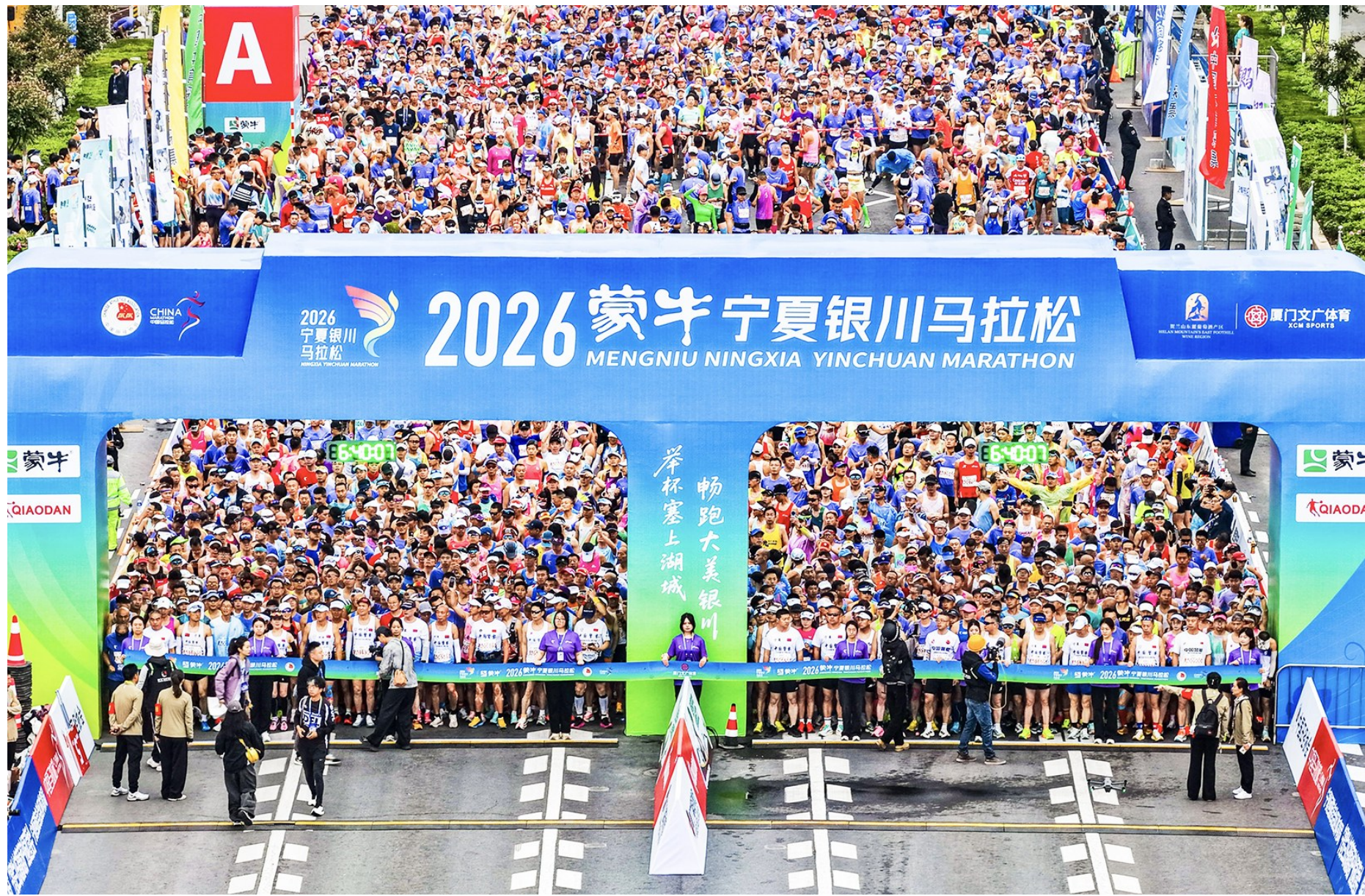
▲2026蒙牛宁夏银川马拉松起点处,2.5万名参赛选手整装待发。