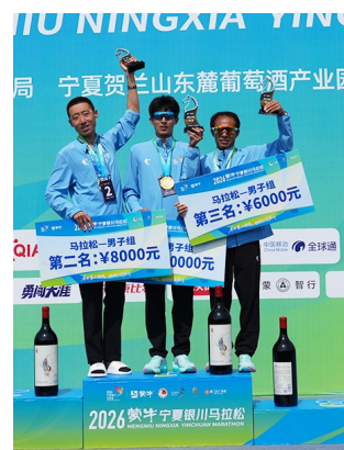
▲马拉松男子组冠、亚、季军合影留念。