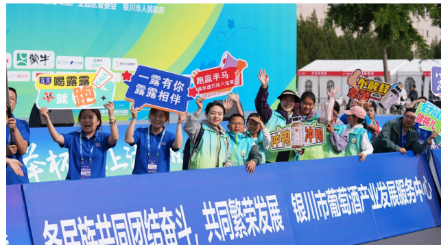
▲市民为参赛选手加油鼓劲。