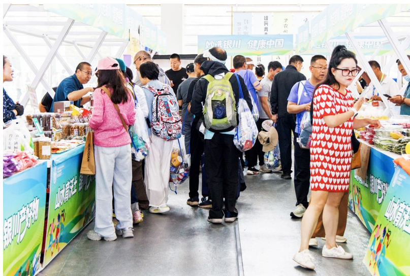
2026银马体育消费季人气爆棚,参赛选手与市民同逛展区,解锁赛事周边与特色好物。