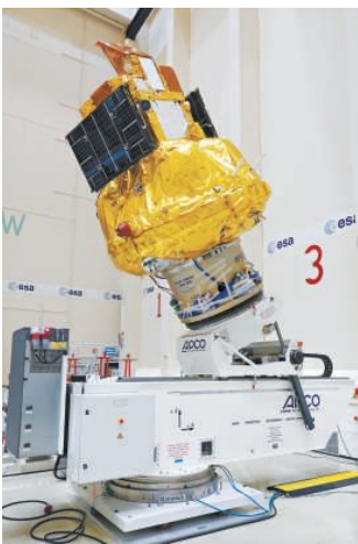
“微笑”卫星进行发射前试验。

（地球磁层中被磁场捕获的高能带电粒子聚集区），同时可长时间对准磁层与太阳风相互作用的关键区域进行探测；而当它运行到近地点时，又能快速将观测到的海量数据传回地面。卫星设计寿命为3年，将在太阳活动周期峰值的关键窗口期，持续捕捉太阳风与磁层的动态交互过程。 值得一提的是，“微笑”卫星的名字不仅是英文SMILE缩写的巧合，更有着形象的科学寓意。通过卫星上的软X射线成像仪，科学家预计能观测到磁层朝向太阳边缘形成的类似“微笑弧线”的结构，而南北两极的极尖区则像“眼睛”一样，共同构成一张“太空笑脸”。这张笑脸的背后，正是磁层抵御太阳风的核心区域，也是卫星的主要观测目标。