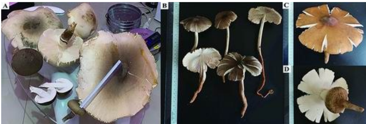
研究供图（蚂蚁伞菌，中国科学院昆明植物所供图）

鸡枞菌（蚁巢伞属）是与大白蚁共生的一类野生食药两用真菌。蚁巢伞菌肉酷似鸡肉，烹饪时鲜味浓郁，独特的感官品质深受消费者喜爱，具有很高的市场价值。近日，中国科学院昆明植物研究所山地中心研究团队联合泰国研究团队，对3种蚁巢伞真菌进行挥发性谱分析，系统表征了可用于区分这些物种的差异化标志物。相关研究