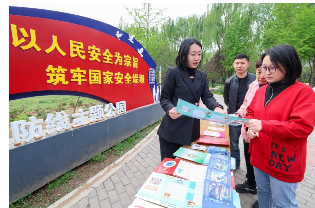
4月14日，在河北省石家庄市新华区石太公园，普法工作人员(左一)为群众讲解国家安全相关知识。

践行正确政绩观学习教育工作提示》等，确保全体参会人员吃透核心要义、把握精神实质。 与会人员一致表示，切实把学习成效转化为履职尽责的具体行动，深刻领悟“两个确立”的决定性意义、坚决做到“两个维护”。将聚焦教育公平、科技创新赋能、公共卫生体系完善等民生关切，深入基层一线开展专题调研，精准建言资政。以树立和践行正确政绩观为引领，强化责任担当，密切联系界别群众，多建睿智之言、多献务实之策、多尽履职之力，切实解决群众急难愁盼问题，以实干实绩为全区经济社会发展贡献智慧和力量。