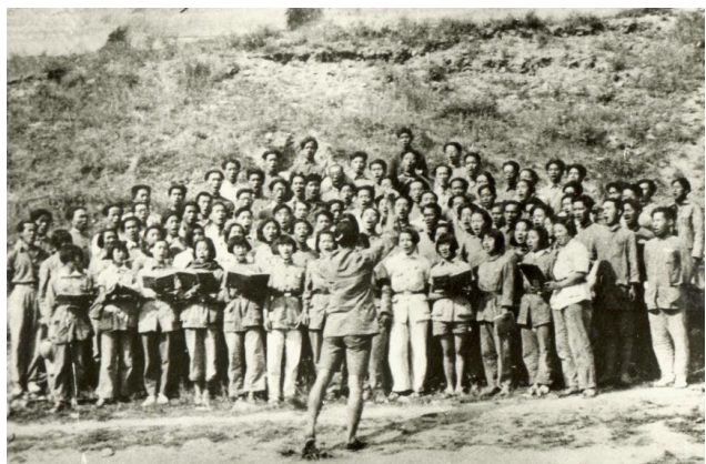
▶1939年，冼星海指挥鲁艺学员排练《黄河大合唱》。

“风在吼，马在叫，黄河在咆哮……” “向前，向前，向前！我们的队伍向太阳……” “啊，延安！你这庄严雄伟的古城，到处传遍了抗战的歌声……”