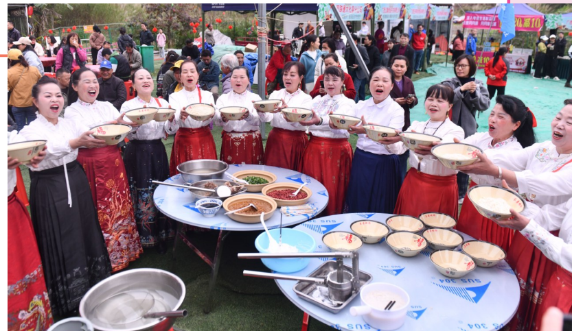
人们在广西河池市大化瑶族自治县“生榨米粉非遗技艺比拼”活动中展示生榨米粉(3月21日摄)。

生榨米粉是广西河池、南宁等地的民间传统小吃,深受广大市民和游客的喜爱,其制作技艺被列入广西非物质文化遗产名录。