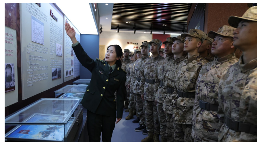
为深化役前教育、厚植家国情怀,3月20日,海原县县武部组织2026年上半年预定新兵前往牌路山烈士陵园纪念馆,开展“缅怀英烈寻初心 从军入伍报家国”红色教育活动,进一步筑牢预定新兵投身军营、报效祖国的思想根基。

同步启动的还有“举杯贺兰山”首届CMB品酒师挑战赛,并开启全球招募。赛事分全国城市初赛、银川总决赛两轮,4月至6月开展初赛,赛题融入宁夏产区特色酒款;总决赛集结全国百强选手,沉浸式感受产区风土。赛事设置丰厚激励,全国五强可获全额资助直通2027年CMB国际评委,冠亚军最高可得2万元现金奖励。另设“最佳红葡萄酒品鉴奖”“最佳白葡萄酒品鉴奖”,对在细分品类中表现突出的选手予以表彰。