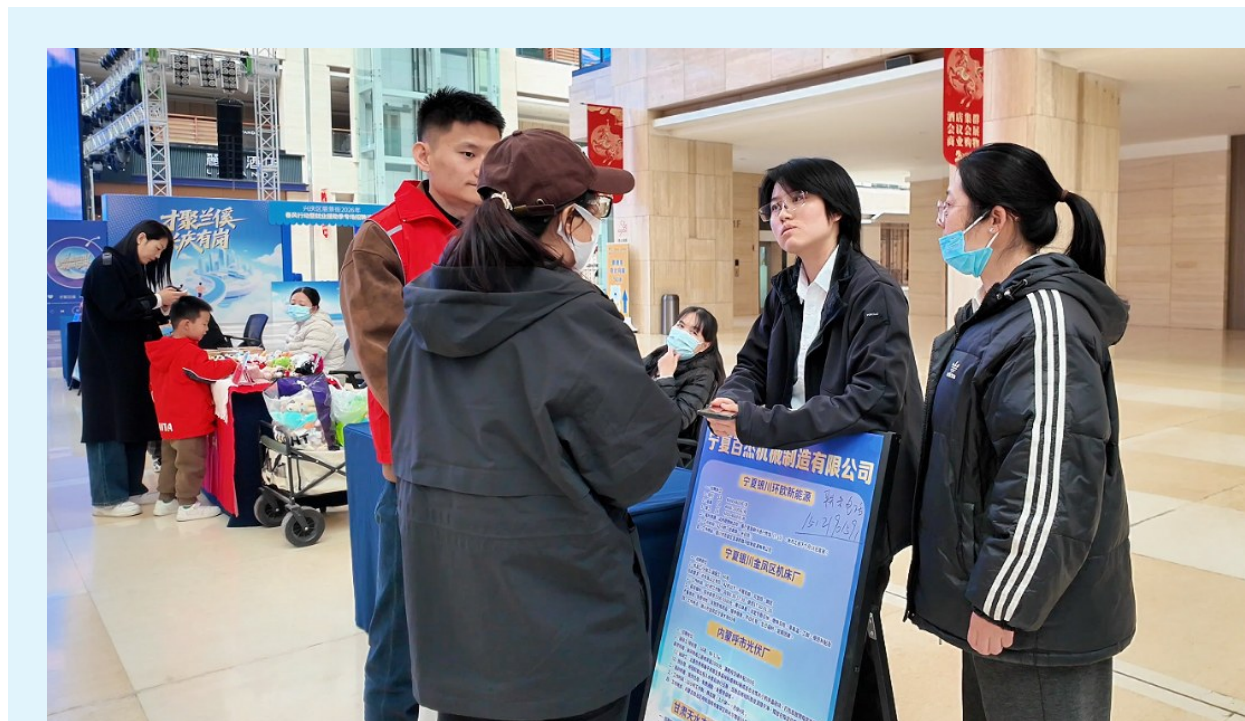
3月21日,兴庆区丽景街举办2026年春风行动暨就业援助专场招聘活动,紧扣春季用工需求,聚集新能源、科技、商贸服务、医疗健康等38家优质企业,带来937个就业岗位,涵盖技术、管理、营销、服务等各个领域。活动特别开设助农助残、爱心岗位、残健融合公益市集等特色专区,联动公益组织与爱心企业,为特殊群体拓宽就业创业渠道,让就业服务覆盖更多人群。

作为西北地区唯一的全国省级水网先导区,我区正加快构建现代水网体系。自治区水利厅将持续深化水利宣传,引导全社会参与水网建设和水生态保护,以实际行动守护黄河安澜,绘就宁夏水利高质量发展新画卷。 (刘媛)