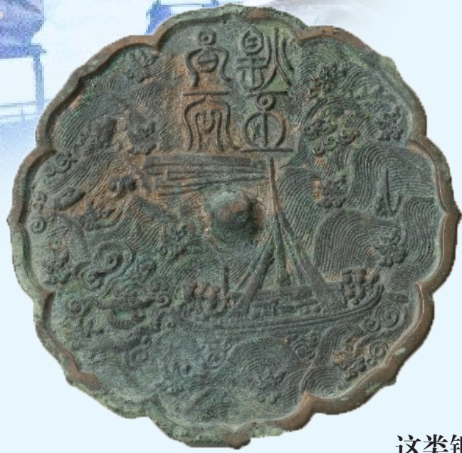
“煌丕昌天”海船纹铜镜。

这面“煌丕昌天”海船纹铜镜，不只是照面的日用器物，更是一卷微型古代航海图。镜面上，海船扬帆破浪，海鸟盘旋流转，一镜一画，都是古人驶向远洋的真实写照。