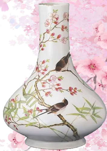
清代粉彩杏林春燕纹瓷瓶。