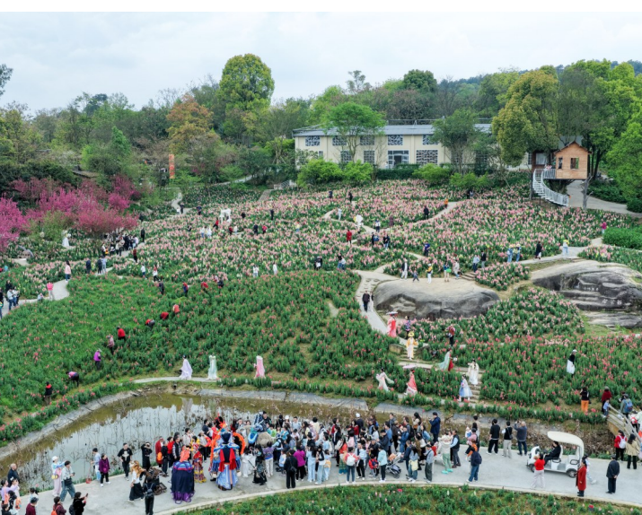
3月22日，游客在重庆市巴南区二圣镇集体村云林乡景区踏青游玩(无人机照片)。

“自治区科技厅、国资委将一如既往地当好企业科技创新的‘店小二’、做好‘服务员’，在政策供给、平台搭建、服务保障等方面协同发力，共同为国有企业创新发展注入强劲动能。”自治区科技厅副厅长马龙说。