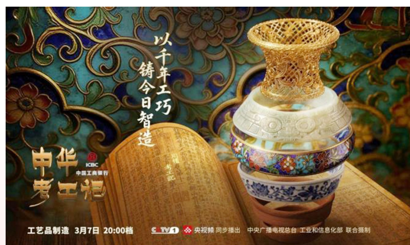
《中华考工记》工艺品制造篇海报。

大型工业文化节目《中华考工记》工艺品制造篇3月7日晚在央视综合频道开播,主持人和嘉宾带领观众循着《考工记》所载的玉、陶、金三大传统工艺体系,探寻现代工艺品制造业的传承与创新。