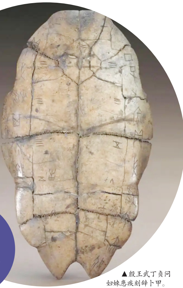
▲殷王武丁贞问妇妹患疾刻辞卜甲。