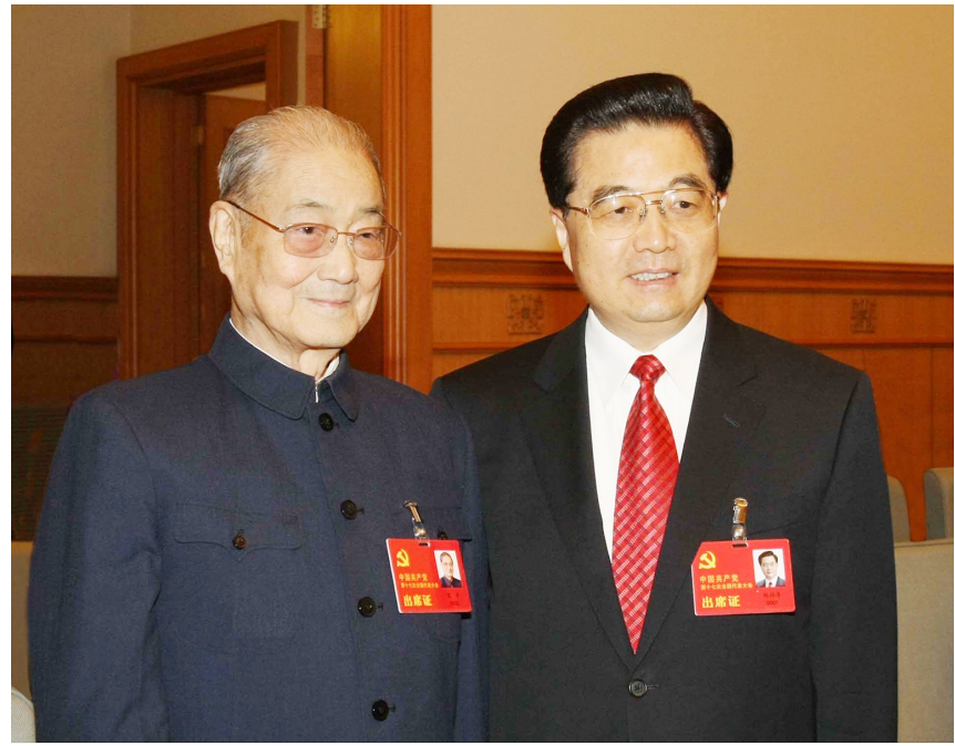
2007年10月21日，在党的十七大闭幕前，胡锦涛同志同宋平同志在一起。