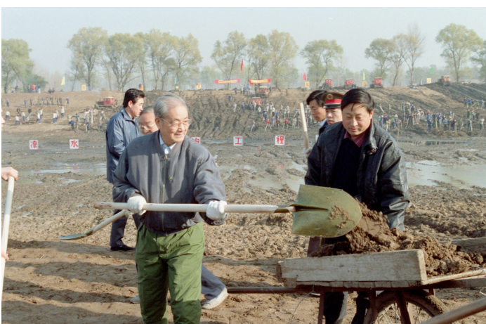
1991年11月13日，宋平同志(左)到北京通州区张家湾凉水河整治工程工地参加劳动。