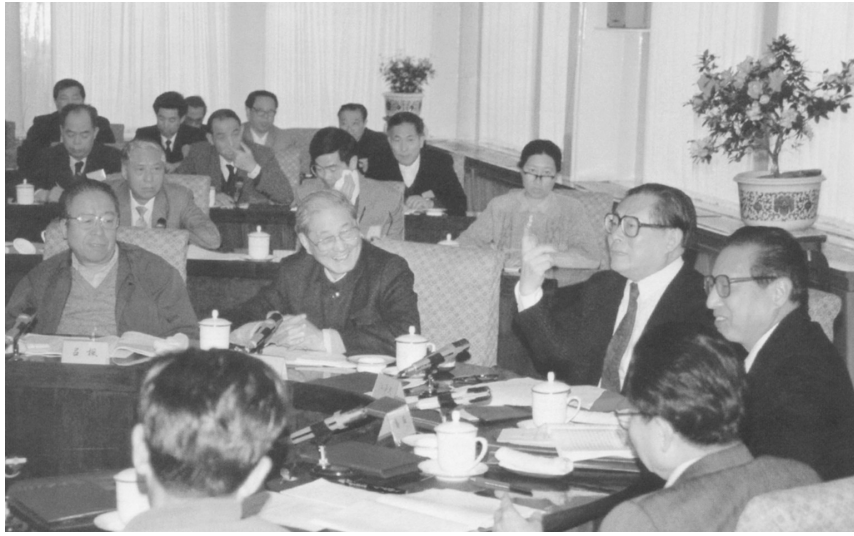
▲1991年4月，江泽民同志、宋平同志(前排左二)等与参加党建理论讨论会的代表座谈。