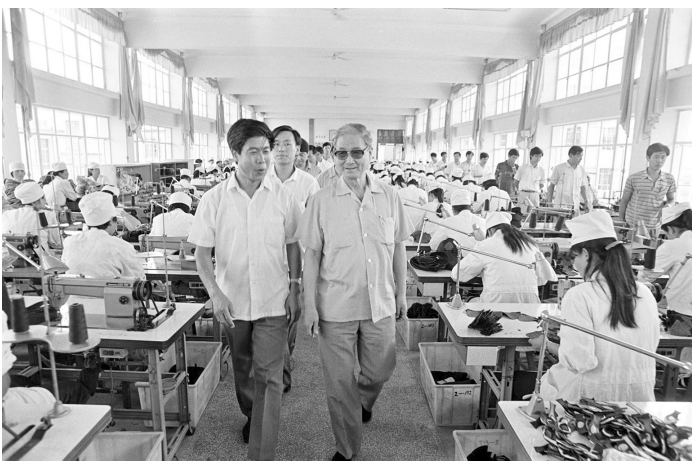
1990年8月14日，宋平同志(右)在山东省威海市文登区考察。