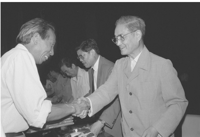
1991年6月26日，中共中央组织部、中共中央宣传部等单位在北京召开大会，表彰全国高校优秀思想政治工作者。这是宋平同志(右)向获奖的个人颁奖。