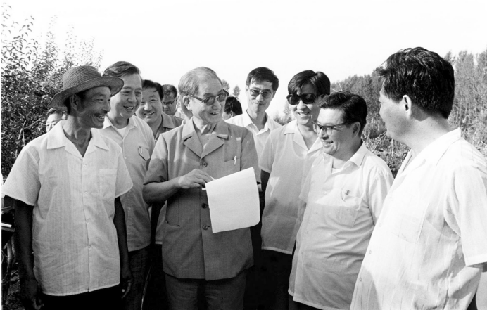
1990年7月中下旬，宋平同志(前左二)来到内蒙古自治区巴彦淖尔市临河区马场地村了解基层党支部建设情况。