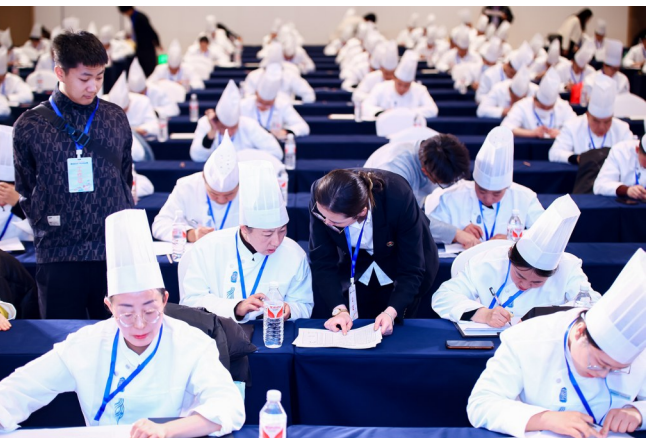
参赛选手进行理论考试。