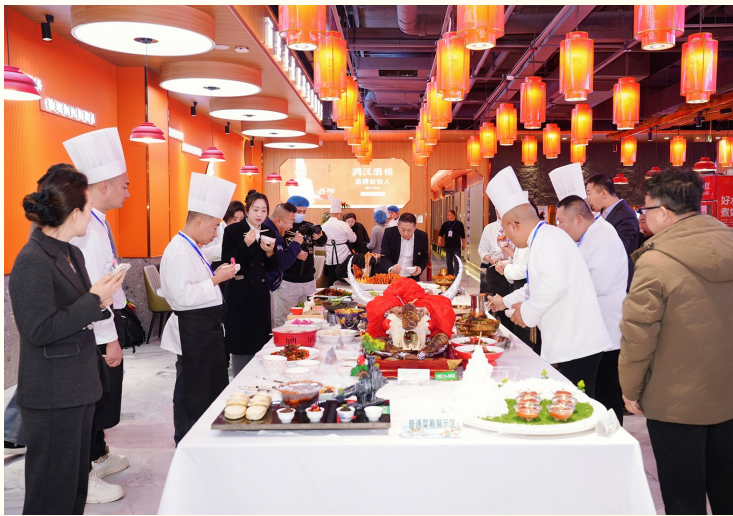
参赛美食吸引大家品尝。

赛场上，选手们凝神专注、各展所长。煎炒烹炸间尽显功底，刀工火候中藏着匠心，将寻常食材精心雕琢成一道道色香味形兼具的佳作，全方位展现宁夏美食的多元魅力。“我们不仅想在赛场比拼技艺，更希望深挖本土食材的潜力，让每一道菜都能诉说属于宁夏的独特故事。”一名来自银川市的参赛厨师，话语间满是对职业的爱与对本土美食的热情。 此次大赛巧妙串联起“品特产·寻年味”消费促进活动，现场特设五市非遗美食展区与“六特”农产品展区，邀请市民代表近距离互动品鉴，在唇齿留香间拉近了美食与大众的距离，让赛事更具烟火气。