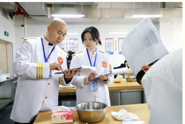
大赛裁判对参赛作品进行现场点评。