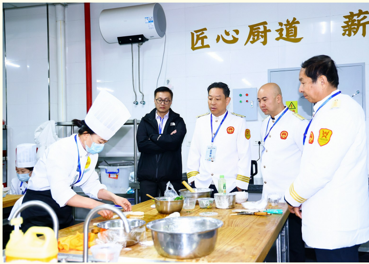
大赛裁判对参赛选手的厨艺进行点评。