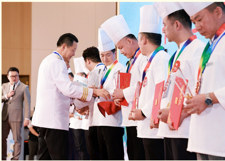
大赛为获奖选手颁发奖牌。