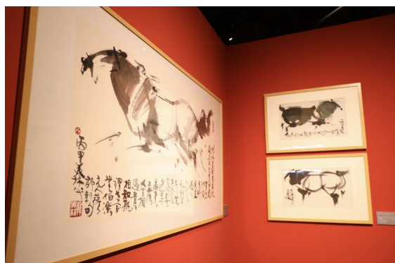
首次 在展会展出。韩美林绘画作品《水墨马》