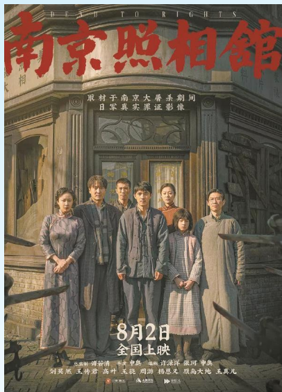
▲电影《南京照相馆》海报。 ►电影《哪吒之魔童闹海》海报。