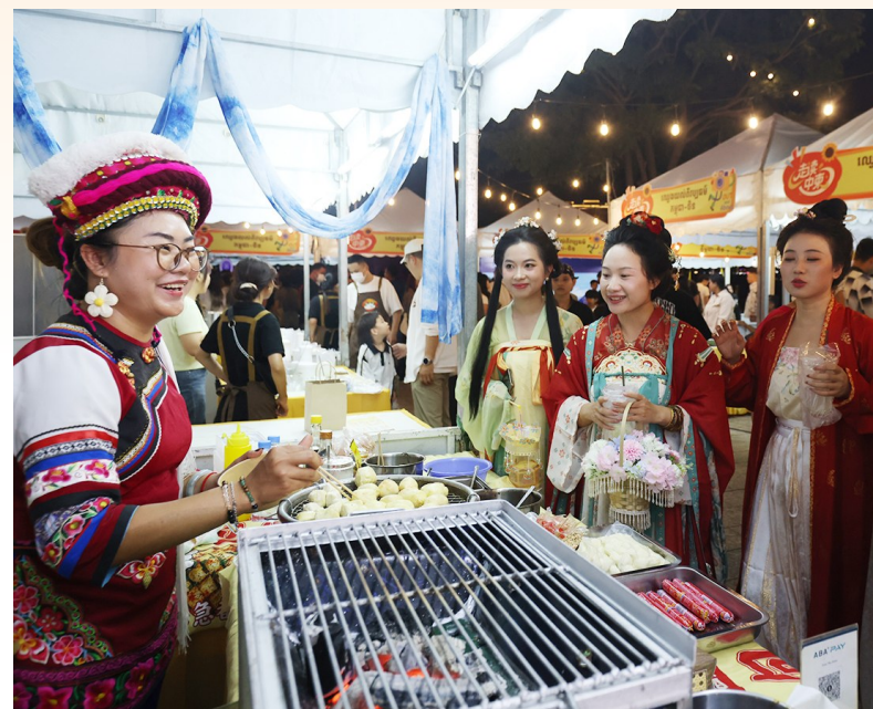
12月14日，在柬埔寨金边，人们在“走读中柬”系列文化活动中体验中国美食。

由五洲传播出版传媒有限公司主办的“走读中柬”系列文化活动中柬文化市集13日至14日在柬埔寨首都金边举行。为期两天的活动吸引大量当地民众与各国游客参与。