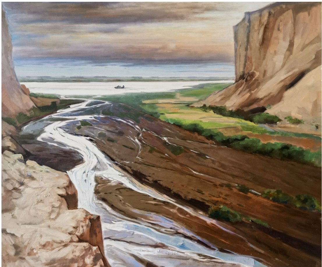
▲《黄河系列之兵沟》(油画)