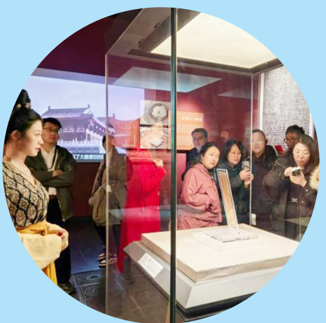
河南博物院镇院之宝武则天金简引围观。

“这一现象并不意外，生动诠释了影视、综艺对文物IP塑造与传统文化传播的强大助推力。”宋朝丽表示，影视剧和文艺节目为文物注入故事性灵魂，让文物IP从抽象概念变得鲜活立体。文创热销更说明影视综艺等对文物IP和传统文化的助推不止于线上热度，更能转化为线下实际消费动能，带动文物所在地文旅和文创产业消费，激发更多创造者对传统文化题材的兴趣，推动传统文化的可持续传播。