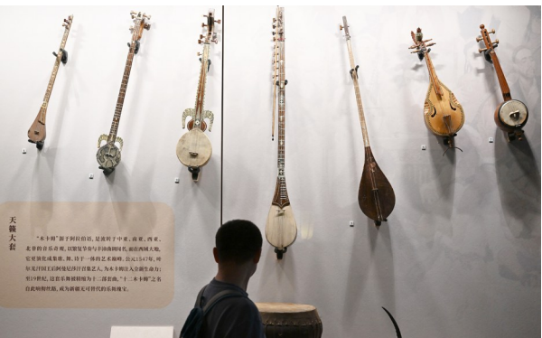
参观者观看展出的乐器卡姆。

《“探寻红色足迹 领略生态魅力”——宁夏博物馆红色研学路线》成功获评“十佳研学线路”，成为西北地区唯一入选该等级的线路项目；《探陶寻踪·泥火承古》获评“精品研学项目”；《我在宁博修文物》研学实践体验营入选“人围研学项目”。自治区文化和旅游厅相关负责人表示，此次获奖项目，从红色基因传承到传统技艺体验，从历史探索到生态认知，全面展示了我区文旅融合与“博物馆+”战略的丰硕成果，展现出我区在文化遗产研学领域的创新活力与实践深度，为讲好宁夏故事、增强文化自信提供了生动载体。