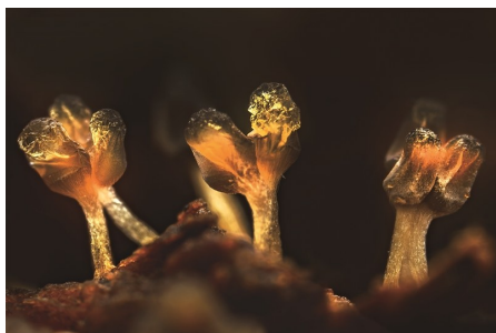
团网菌,子实体的孢子囊呈球形、扁球形或梨形,直径0.5毫米至3毫米。