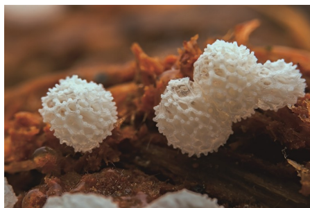
蜂窝状鹅绒菌,以其精巧的蜂巢状结构,在黏菌世界中独树一帜。