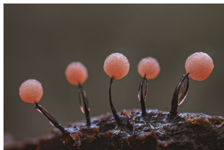
玫瑰绒泡菌颜色多变,整个生命周期会出现紫红色、玫瑰色、粉红色、红褐色等颜色。

自然界有一种特别奇特的生物——黏菌。它既不是植物,也不是动物,名字里虽然带有“菌”字,却既不属于真菌也不属于细菌,而是属于原生生物界(1969年惠特克提出五界分类:原核生物界、原生生物界、真菌界、植物界和动物界)的一类。黏菌喜欢生活在湿润的环境中,常见于腐烂的木材、土壤表面或树叶上,色彩艳丽,形如果冻且