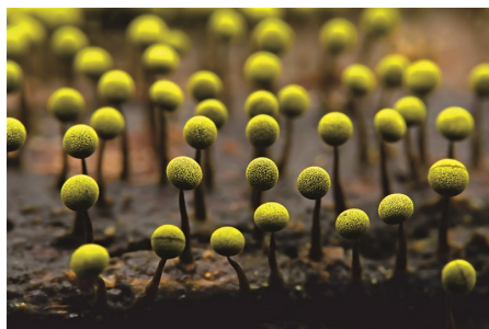
绿绒泡菌的颜色以鲜绿和黄绿色为标志性特征,子实体呈球形有囊轴,具有超强的觅食能力。