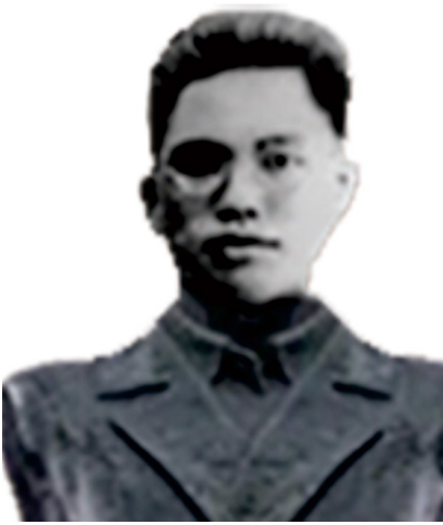
黄文杰像(资料照片)。

广东省梅州市兴宁市大坪镇上大塘村，一座“三堂二横”泥砖瓦结构的房子依山傍河而建。这座始建于清朝的房屋，是革命烈士黄文杰的故居。不久前，大坪中心小学的一群少先队员在这里上了一堂特殊的课。隔