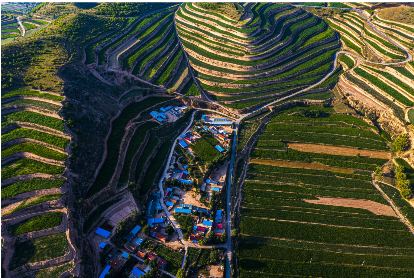
《梯田之下有人家》（摄影） 祁学斌 摄（原州区政协委员）