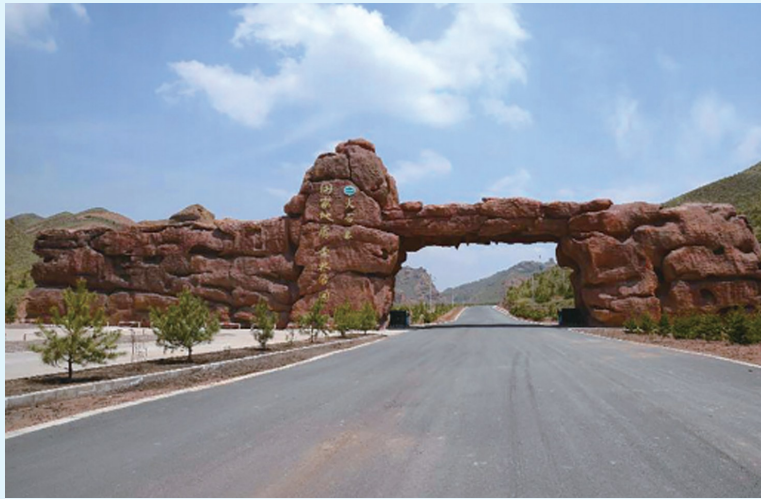
火石寨景区大门。(资料图片)

火石寨，位于西吉县城西北15千米的火石寨乡境内，系喀斯特地貌，因山体岩石呈暗红色，尤其在树木草丛的掩映下，如同一团团燃烧的火焰，故被称为火石寨；又因喀斯特地貌犹如耀眼的红霞，故称丹霞地貌。火石寨丹霞地貌群面积为95.75万平方米，以险峰、怪石、悬崖、茂树等堪称“四绝”。是国家级地质公园、森林公园、自然保护区和4A级景区，也是我国北方海拔最高、发育最为典型、分布最为集中、造型最为奇特、规模最为宏大的丹霞地貌群。被命名为全国第一批国土资源科普基地，具有极高的科研价值和旅游观赏价值，是游玩览胜、休闲度假、避暑疗养、攀岩探险的绝佳去处。