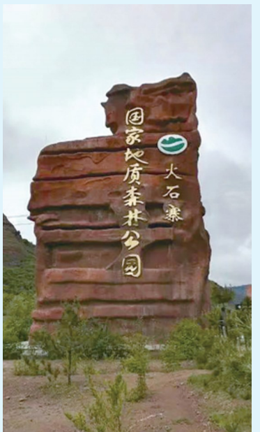
火石寨国家地质森林公园。(资料图片)

火石寨国家地质公园依托西吉县境内的重点文物保护单位——将台堡、秦长城、北魏石窟群、月亮山高山草场、党家岔国家级地震滑塌堰塞湖遗址，以及须弥山和六盘山等外围景区，构建起别具特色的公园。火石寨国家地质公园展览馆遵循“集科学性、启发性、参与性和趣味性为一体”的宗旨，以火石寨丹霞地貌的特点和成因为主线，对本区的地质背景、地质景观、中生代的沉积环境和沉积构造类型、1.4亿年以来地质遗迹等作了充分的展示。火石寨国家地质公园的开发和建设，对推动本地区的经济社会发展有着重要的意义。它标志着火石寨景区将成为地质科研、教育、旅游的重要基地，也将成为人们旅游、休闲、度假的好地方，必将对保护地质遗迹、生态环境等起到积极的作用。（据《多彩西吉》）