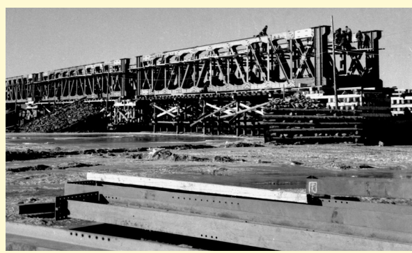
1959年2月正在修建中的青铜峡黄河铁桥。