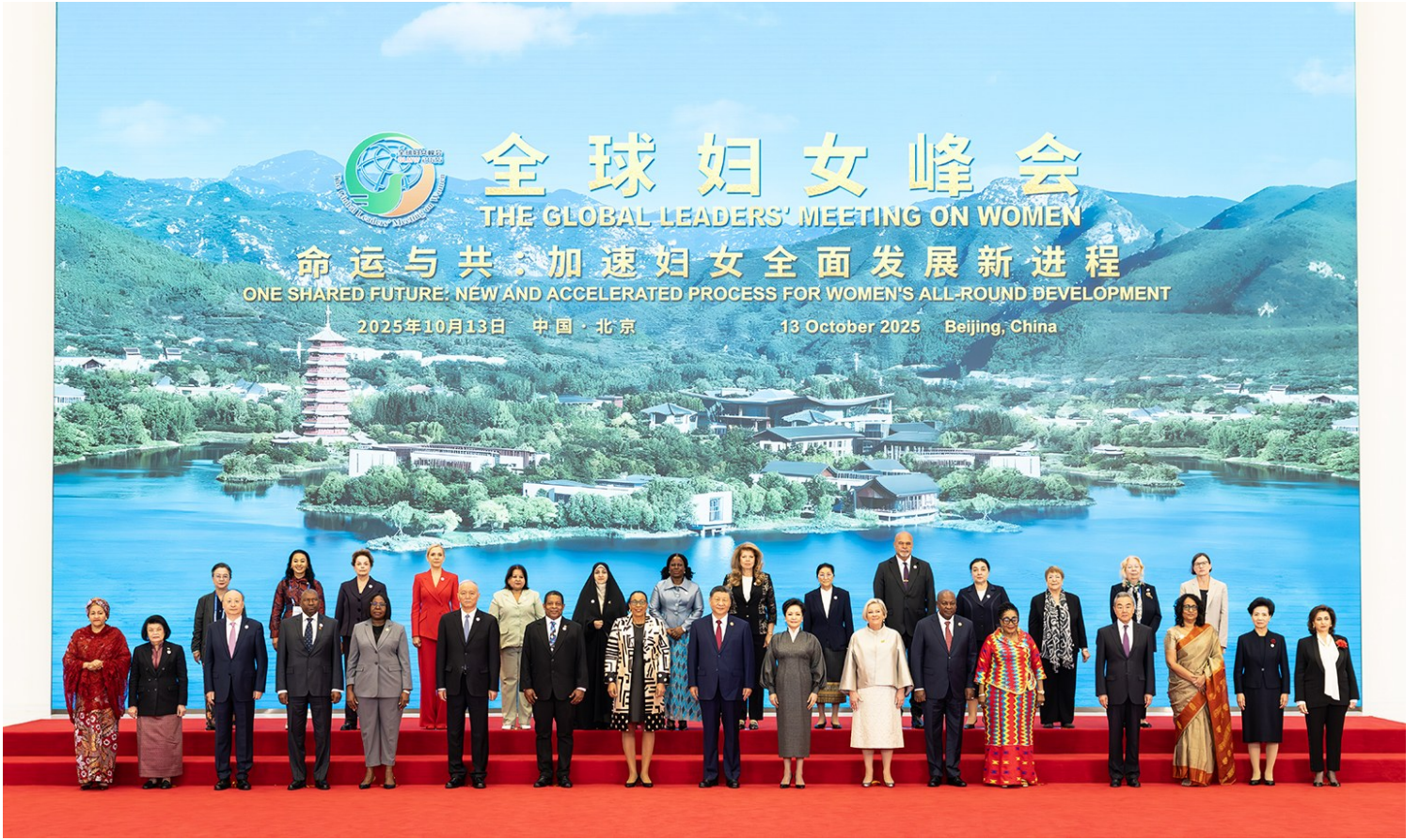
10月13日上午,国家主席习近平在北京国家会议中心出席全球妇女峰会开幕式并发表主旨讲话。这是习近平和夫人彭丽媛同与会各国和国际组织代表团团长夫人合影留念。

新华社北京10月13日电 10月13日上午,国家主席习近平在北京国家会议中心出席全球妇女峰会开幕式并发表主旨讲话。 金秋时节,天朗气清。国家会议中心会场内,各国国旗和联合国旗帜组成恢弘旗阵。 习近平和夫人彭丽媛同与会各国和国际组织代表团团长夫人亲切握手并合影留念。 在热烈的掌声中,习近平发表题为《弘扬北京世妇会精神 加速妇女全面发展新进程》的主旨讲话。 习近平指出,妇女是人类文明的重要创造者、推动者、传承者,推进妇女事业发展是国际社会的共同责任。30年前,北京世妇会确立“以行动谋求平等、发展与和平”的崇高目标,通过了具有里程碑意义的《北京宣言》和《行动纲领》,将性别平等列入时代议程,激励全世界的人们为之接续奋斗。30年来,在北京世妇会精神指引下,全球妇女事业蓬勃发展,为人类文明进步增添了亮丽色彩。追求男女平等已经成为国际社会普遍共识,妇女赋权取得显著进