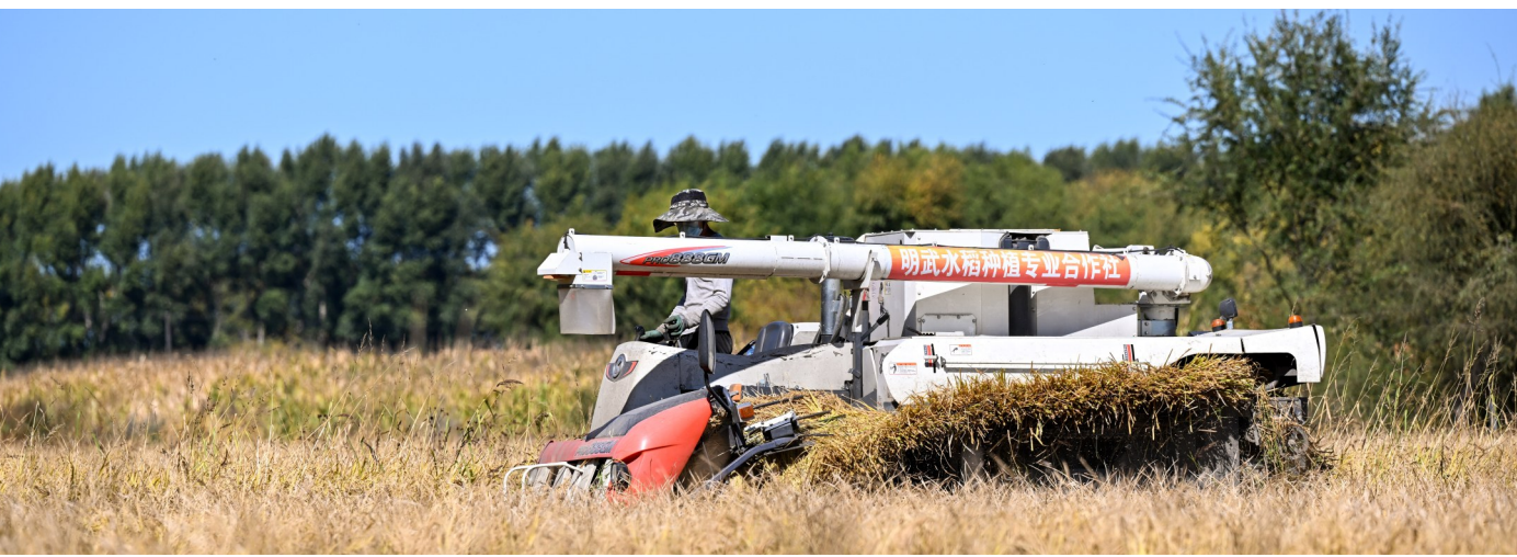
9月26日，农户在内蒙古兴安盟乌兰浩特市义勒力特镇一处稻田收割水稻。 金秋时节，内蒙古兴安盟乌兰浩特市的水稻喜迎丰收。农户们抢抓晴好天气，加紧收割加工。