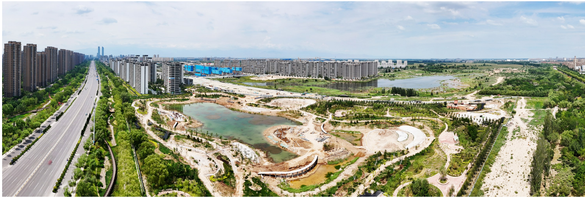
金凤区大碱湖海绵湿地生态公园建设现场(无人机照片,8月18日摄)。

位于金凤区团结路与唐徕渠交叉口西南角的大碱湖海绵湿地生态公园占地超10万平方米,以“松涛观荷”为主题,巧妙融合了四季景观特色。该项目不仅注重生态修复,还规划了共享运动场、沙水乐园等多元化活动空间。