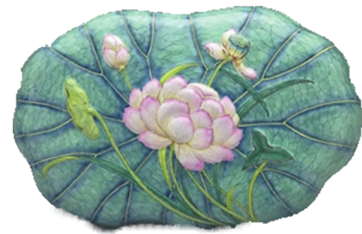
清乾隆画珐琅荷叶式盒。

“叶上初阳干宿雨，水面清圆，一一风荷举。”烈日炎炎，荷叶轻舞，随风摇曳，似乎在诉说着夏日别样的浪漫与温柔。清乾隆画珐琅荷叶式盒，现藏于台北故宫博物院。此盒为铜胎材质，盒面呈现不规则荷叶造型，盒盖篆刻浅浮雕式一把莲纹饰。粉红娇嫩的荷花与将开未放的花蕾、莲蓬相映成趣，柔顺的莲枝则横依盒身至圈足，再以深绿的线条勾勒叶脉，若隐若现地作为锦地，使嫩红的荷花显得更为淡雅清丽而亮眼。盒内壁涂浅蓝釉，矮圈足饰有装饰图案，底白地中央书红色“乾隆年制”双方框双行楷书款。此盒融合画珐琅与内填珐琅工艺中造型独特的典范之作。