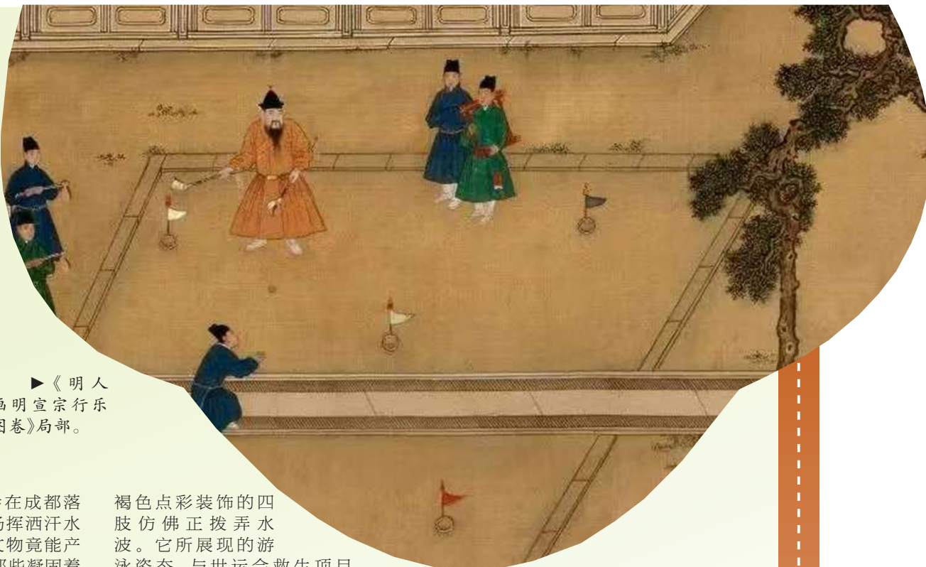
▶《明人画明宣宗行乐图卷》局部。