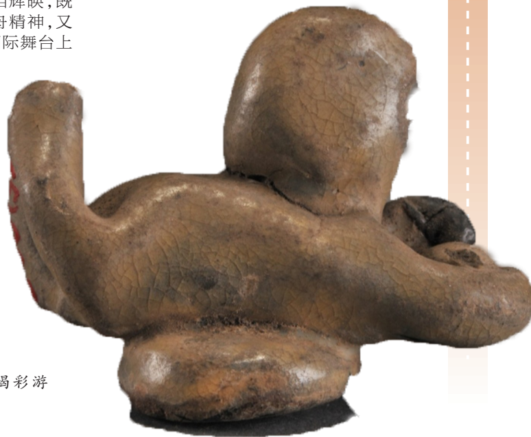
▶北宋青釉褐彩游泳瓷塑。