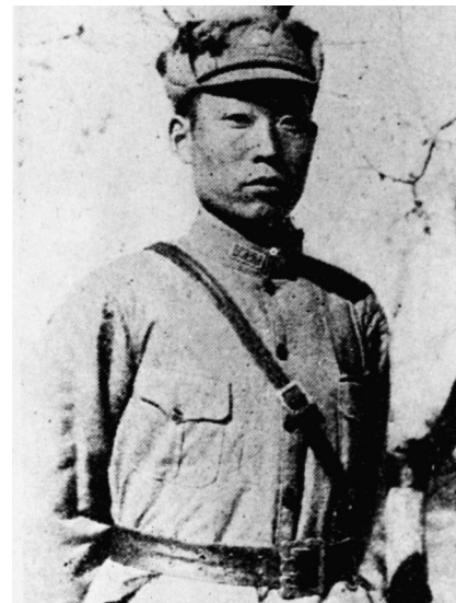
这是赵登禹像(资料照片)。