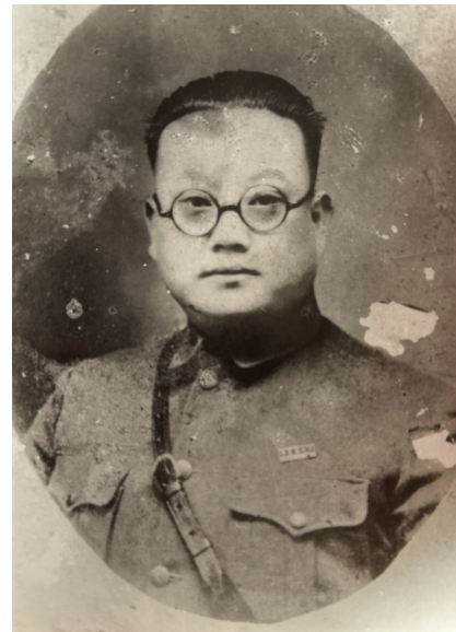
滕久寿戎装照(资料照片)。

在贵州省三都县烈士陵园的山顶上，苍翠松柏间，一座纪念雕像巍然矗立，目视远方。他是为保卫中华民族而牺牲的爱国将领滕久寿。1932年，