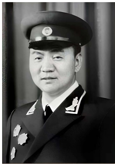
涂宗德军衔礼服照。(资料图片)

涂宗德(1915—1988)，江西省黎川县日峰镇下桥村人。少年时，家境贫苦，在家种田和到烟钱当学徒。1931年6月，红军首次来到黎川，他义无反顾毅然投身革命，被编入闽粤赣游击队任通信员，后任闽粤赣独立团班长。1933年6月7日，中革军委决定：闽北独立师、建(宁)黎(川)泰(宁)独立师和邵(武)光(泽)独立团等，合编为第20师，成为红一方面军第7军团的一部分。涂宗德在闽粤赣游击队被改编后不久，担任红七军团团长。