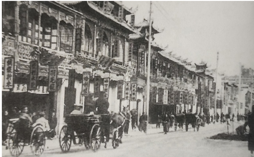
20世纪40年代，银川的“晋商八大家”。

到银川来寻找商机的外地人，在宁夏的移民史上是留有足迹的。他们是宁夏早期商业移民，其中具有代表性的就是清朝末年山西商人在今银川老城创办的8家商号，被人们称为“晋商八大家”。其中，除百川汇商号创办于清宣统三年(1911年)外，其余7家均创办于清同治末年。