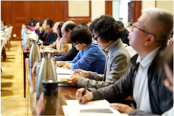
▲课堂上,学员们认真听课详细记录。