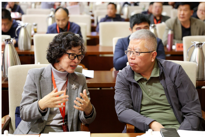
▲学员们讨论授课内容。

学思践悟,以学为基。 开展学习是人民政协重要的基础性工作。4月21日至25日,自治区政协第六期委员学习培训班在宁夏财政干部教育培训中心举办。260余名区、市、县(区)三级政协委员和部分自治区政协、各民主党派区委会、自治区工商联的机关干部参加培训。 全面系统的学习、精彩生动的讲座、坦诚热烈的讨论……在5天紧凑高效的培训学习中,委员们碰撞思想、交流心得、相互启发,边思边悟,努力提升履职能力,汲取前行力量,为推动政协工作提质增效创新发展蓄势赋能。 “委员学习培训班很‘解渴’。通过深入细致地学习,关于人民政协理论创新的脉络和逻辑更加清晰,理论体系更加系统完整。” “思想得到了解放,精神得到了升华,理念得到了更新,这是一次高质量的思想再‘充电’、行动再‘赋能’。在今后的履职中将从工作岗位实际出发,深入基层、深入群众,找准问题的切入点、结合点、着力点,全面了解情况、弄清事情原委、找准问题症结、寻求破解之道,做到既要‘身入’、更要‘心入’,切实当好群众的‘代言人’。” …… 培训期间,委员们认真学习,积极参与课后讨论与互动环节,撰写学习心得体会,提高了理论素养,增强了履职本领,涵养了为政之德,强化了自我约束。 学而思、思而践、践而悟。培训结束后,委员们的行囊里装着沉甸甸的学习资料,手机里存着满满的课件照片,心里揣着热乎乎的履职计划。大家纷纷表示,将进一步增强学习的自觉性和主动性,不断提高政治站位,把握正确政治方向,增强能力本领,履行好委员职责,发挥更大作用,为政协事业高质量发展 and 强国建设、民族复兴贡献力量。