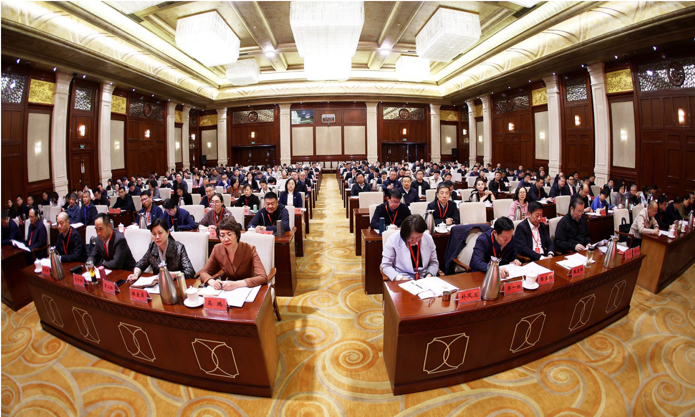
▲4月21日至25日,自治区政协第六期委员学习培训班在宁夏财政干部教育培训中心举办。

学思践悟,以学为基。 开展学习是人民政协重要的基础性工作。4月21日至25日,自治区政协第六期委员学习培训班在宁夏财政干部教育培训中心举办。260余名区、市、县(区)三级政协委员和部分自治区政协、各民主党派区委会、自治区工商联的机关干部参加培训。 全面系统的学习、精彩生动的讲座、坦诚热烈的讨论……在5天紧凑高效的培训学习中,委员们碰撞思想、交流心得、相互启发,边思边悟,努力提升履职能力,汲取前行力量,为推动政协工作提质增效创新发展蓄势赋能。 “委员学习培训班很‘解渴’。通过深入细致地学习,关于人民政协理论创新的脉络和逻辑更加清晰,理论体系更加系统完整。” “思想得到了解放,精神得到了升华,理念得到了更新,这是一次高质量的思想再‘充电’、行动再‘赋能’。在今后的履职中将从工作岗位实际出发,深入基层、深入群众,找准问题的切入点、结合点、着力点,全面了解情况、弄清事情原委、找准问题症结、寻求破解之道,做到既要‘身入’、更要‘心入’,切实当好群众的‘代言人’。” …… 培训期间,委员们认真学习,积极参与课后讨论与互动环节,撰写学习心得体会,提高了理论素养,增强了履职本领,涵养了为政之德,强化了自我约束。 学而思、思而践、践而悟。培训结束后,委员们的行囊里装着沉甸甸的学习资料,手机里存着满满的课件照片,心里揣着热乎乎的履职计划。大家纷纷表示,将进一步增强学习的自觉性和主动性,不断提高政治站位,把握正确政治方向,增强能力本领,履行好委员职责,发挥更大作用,为政协事业高质量发展 and 强国建设、民族复兴贡献力量。