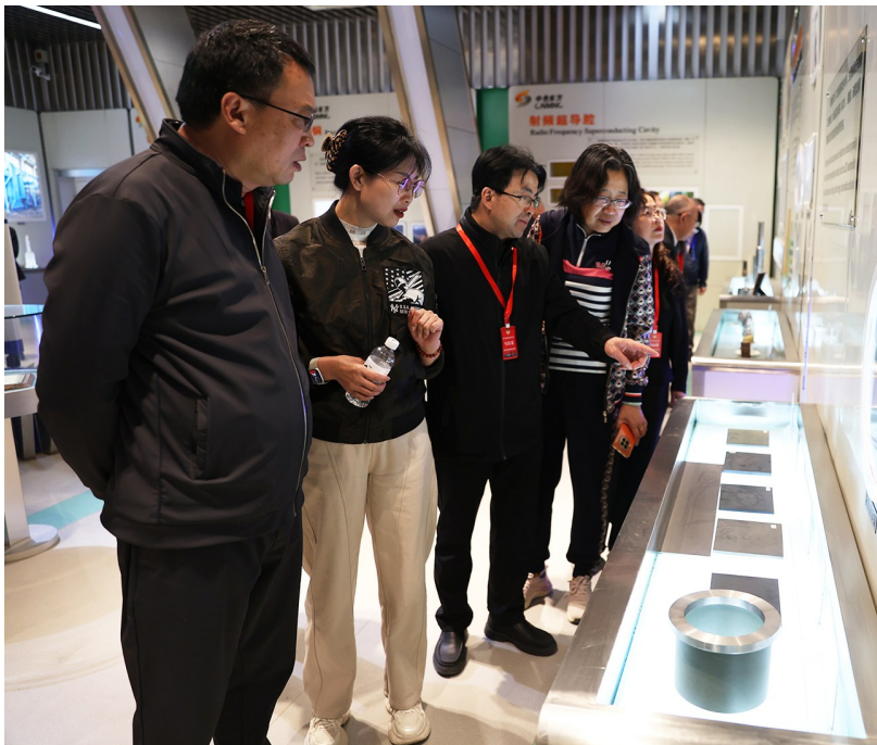
▲现场教学环节,学员们走进中色(宁夏)东方集团有限公司,了解企业创新发展成果。