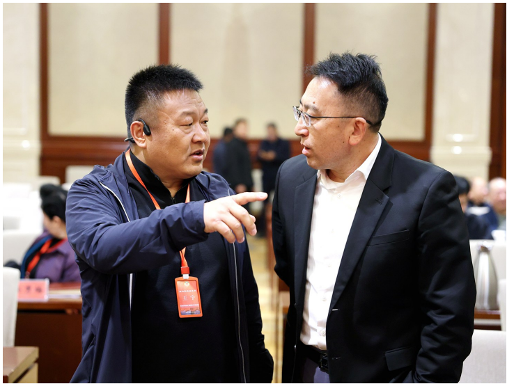
▲课间,学员们就关心的话题进行交流。