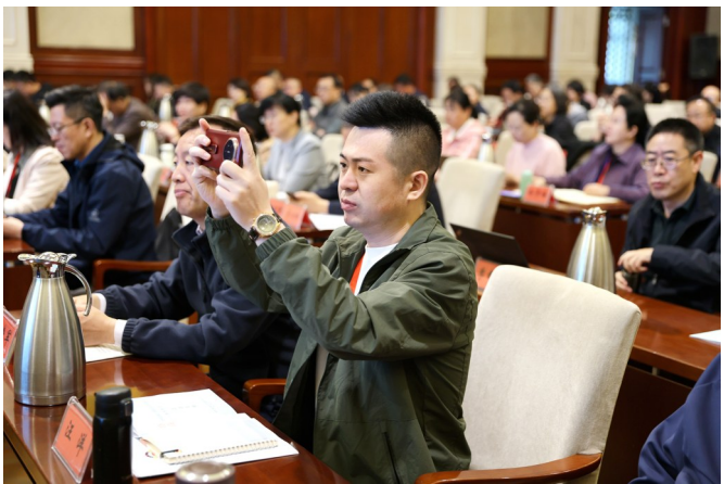
▲学员们拿出手机拍摄授课老师的课件。