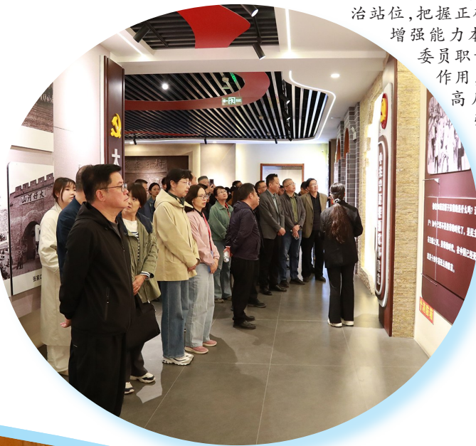
▲学员们来到平罗县黄渠桥镇红色教育基地,接受红色教育。