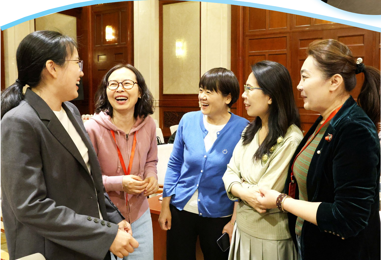
▲课间休息时间,学员们围绕热点问题展开讨论。