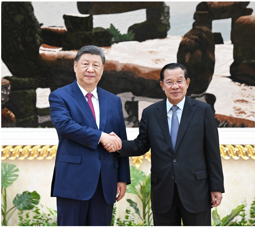
4 月 17 日下午，国家主席习近平同柬埔寨人民党主席、参议院主席洪森在金边和平大厦举行会见。

新华社金边 4 月 17 日电 4 月 17 日下午，柬埔寨国王西哈莫尼同中国国家主席习近平在金边王宫举行会见。 习近平乘专机抵达时，西哈莫尼在下车处热情迎接。礼兵分列红毯两侧。 习近平指出，很高兴在西哈莫尼国王登基 20 周年和柬历新年之际应邀访问美丽的柬埔寨，谨向柬埔寨人民致以新年祝福。柬埔寨国家建设事业蒸蒸日上，相信在西哈莫尼国王庇佑下，勤劳智慧的柬埔寨人民一定能把国家建设得更加繁荣富强。 习近平指出，中柬友好跨越千年，两国人民始终双向奔赴、相互成就。无论国际风云如何变化，中柬两国坚守信义、守望相助，在涉及彼此核心利益和重大关切问题上始终坚定相互支持，树立了大小国家平等相待、真诚互信、互利共赢的典范。中柬两国始终走在构建人类命运共同体前列，给柬埔寨民众带来实实在在的