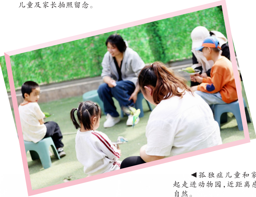
▲孤独症儿童和家长一起走进动物园，近距离感受大自然。