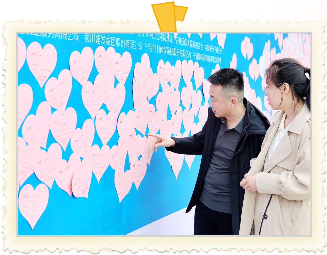
▲贴满了孤独症儿童的「微心愿」墙，吸引市民的目光。