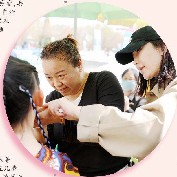
▲家长和老师为即将上台表演的孩子化妆。