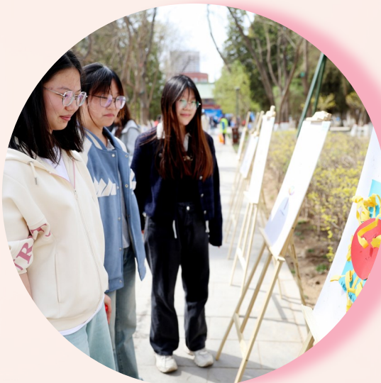
►孤独症儿童的书画作品吸引市民驻足欣赏。