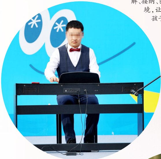
▲孤独症儿童演奏《克罗地亚狂想曲》。

孤独症儿童并非“遥不可及的星星”，他们与所有孩子一样，渴望被看见、被理解。一个善意的微笑、一次耐心的等待、一份平等的尊重，都能为他们打开一扇融入社会的门。大家的关爱，或许不能改变孤独症孩子的世界，但至少可以让他们的世界不再那么孤单。自治区政协将持续发挥自身优势，助推相关政策完善，为孤独症儿童创造一个理解、接纳、包容的社会环境，让更多“星星的孩子”茁壮成长。