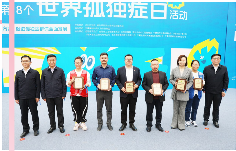
▲部分爱心组织、单位被授予“爱心助残单位”。