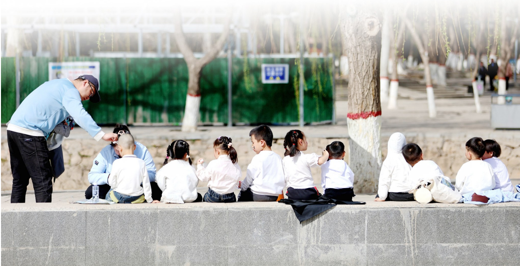
▲老师们为即将上台表演的孤独症儿童加油打气。