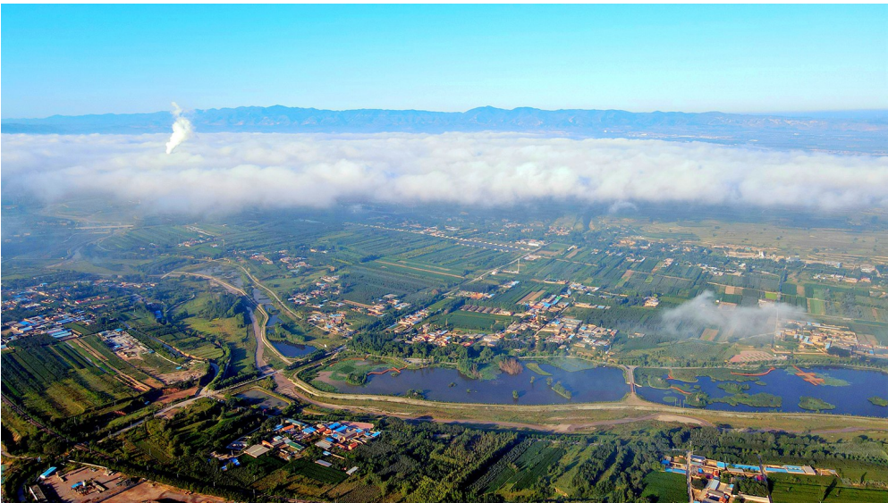
▲《莽原缠玉带·固原》(摄影)