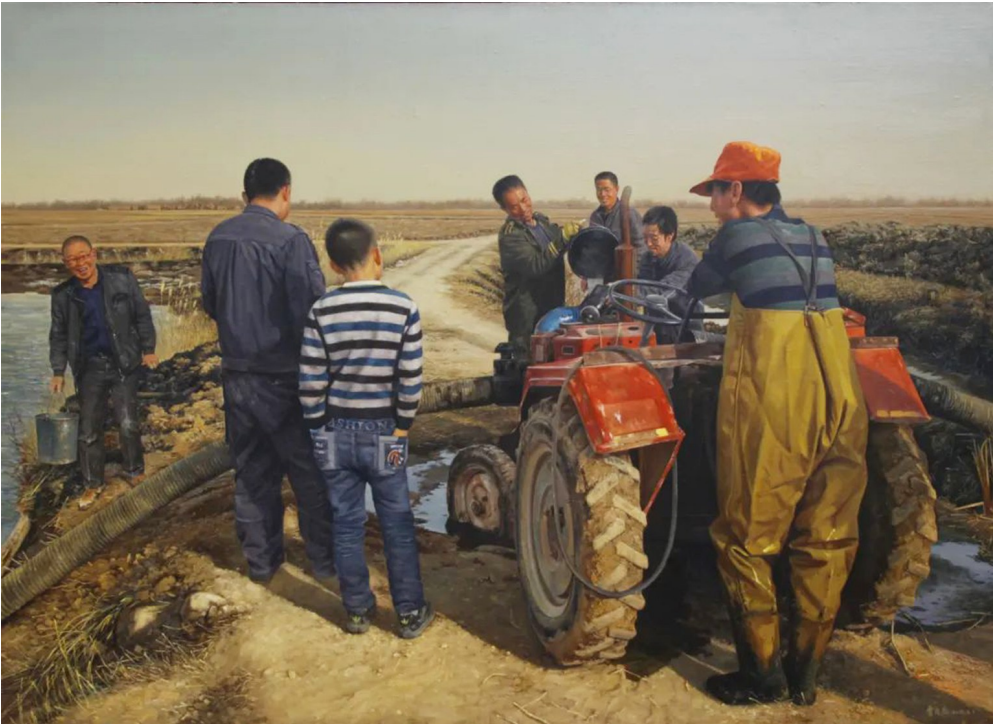
▲《我的田野之三》(油画)