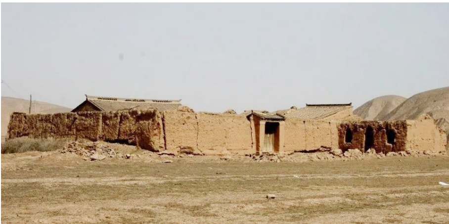
海原县七营镇盘河村邓小平旧居。(历史图片)

6月23日适逢端午节,部队生活条件十分艰苦,伙房供应的仍是高粱馍和脆萝卜。听村里的老人讲,当日下午,邓小平同志挤出时间,到附近的山里打回几只野鸡,让炊事员做成汤。晚饭时,炊事员把炖好的野鸡汤分给文书科的战士们共享。文书科的战士们想到邓小平同志日夜辛劳、工作繁重,都不肯受用。邓小平同志望着推推让让的干部战士,用浓重而浑厚的四川口音对大家说:“今日过端午节,打个牙祭,讲啥子客气嘛?我们红军的规矩,就是有盐同咸,无盐同淡。来,大家快把鸡汤报销了!”文书科的干部战士们见邓小平同志如此关心大家,都乐呵呵