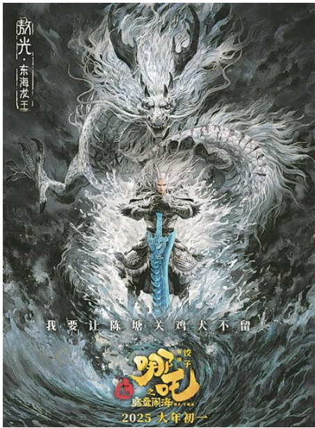
东海龙王敖光角色海报。

中国传统的龙的纹样,大多比较扁平,而《哪吒》电影中出现的龙却是立体真实的。为了让片中的龙看起来更加鲜活,申威和设计组的同事们还会将现实中的一些生物如恐龙和蜥蜴等的结构特征,融入设计中。