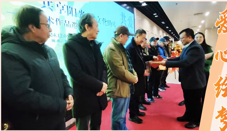
向爱心画家颁发捐赠证书。