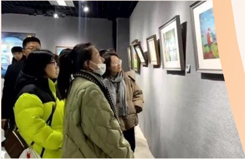
自治区政协机关部分党支部联合开展主题党日,大家认真观赏画作。