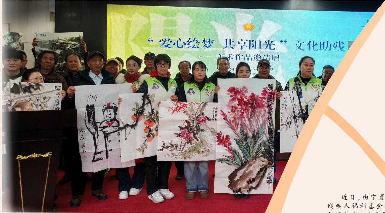
来自宁夏各市的艺术家用向残疾人代表赠送画作。