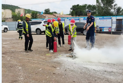
原州区消防救援大队监督员深入辖区施工工地开展消防应急演练。