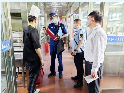
原州区消防救援大队监督员联合市场监管部门开展餐饮场所消防安全检查。