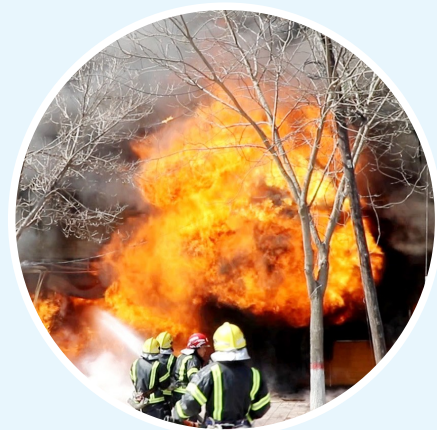
▲原州区消防救援大队救援人员进行救援行动。

坚持严的基调,强化正风肃纪。原州区消防救援大队始终把纪律作为党委班子建设的重要保证,持续开展“强基础、除隐患、保稳定”安全事故案(事)件防范整治活动,强化“人车酒、网电密、婚恋贷”重点领域队伍管理。组织全员走进辖区法院进行参观学习,切身感受法律权威,提高学法、懂法、用法、守法的意识;严格落实从严管治酒工作,开展线上线下酒精测试76次,未发现上班期间违规饮酒现象。目前,大队全体救援人员思想稳定,精神面貌良好,队伍四个秩序正规有序。