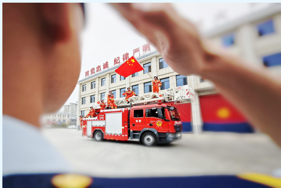
原州区消防救援大队救援人员开展“向国旗敬礼”活动。

2024年,固原市原州区消防救援大队坚持以习近平新时代中国特色社会主义思想、习近平总书记重要训词精神为指引,在各级党委和政府的正确领导下踔厉奋发、笃行不怠,聚焦应急救援能力提升、消防安全责任落实、消防安全基础完善和队伍正规化建设,抢抓机遇、勠力同心,统筹推进防灭火各项中心工作,队伍上下呈现人心思齐追赶超越、人心思进勇毅前行的奋发态势。