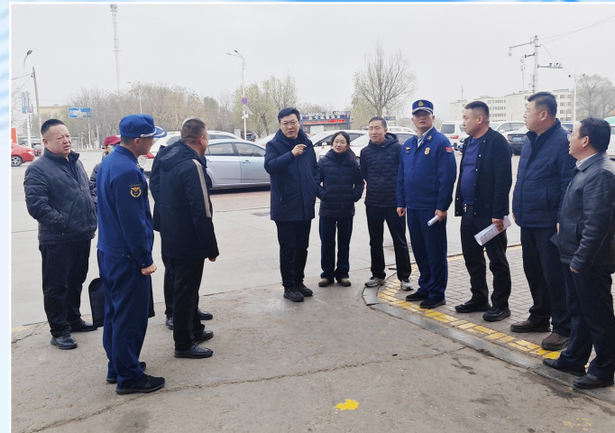
原州区政府相关领导调研指导南滩市场消防隐患整改工作。