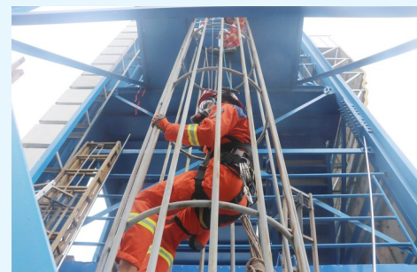
原州区消防救援大队救援人员进行“深井救援”训练。