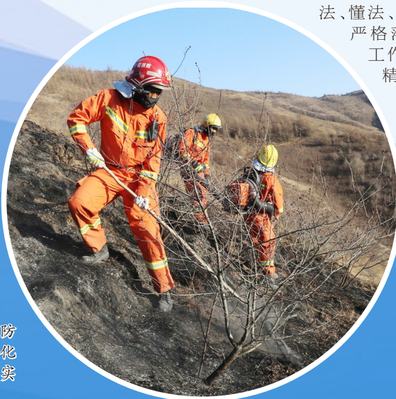
原州区消防救援大队常态化开展灭火救援实战演练。