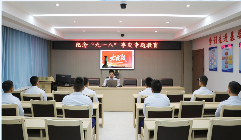
原州区消防救援大队救援人员开展纪念“九一八”事变专题教育。