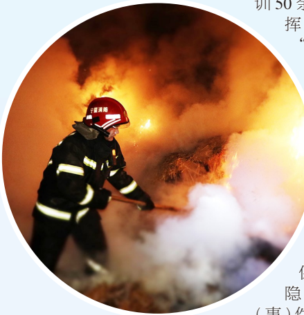
►原州区消防救援大队救援人员开展灭火救援任务。