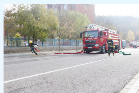
原州区消防救援大队救援人员进行灭火战术操法训练。

州发布”新媒体平台开设“大曝光”专栏,集中曝光典型隐患、突出问题和严重违法行为,6期共曝光30个火灾隐患及单位。制定并发布《三类重点场所消防安全整治指南》,切实指导行业部门集中开展消防安全检查,查清行业领域突出风险隐患;采取“走出去、请进来”的宣传模式,通过走街串巷、上门入户等方式开展宣传84次,发放宣传彩页2万余份,切实提升辖区居民消防安全意识。