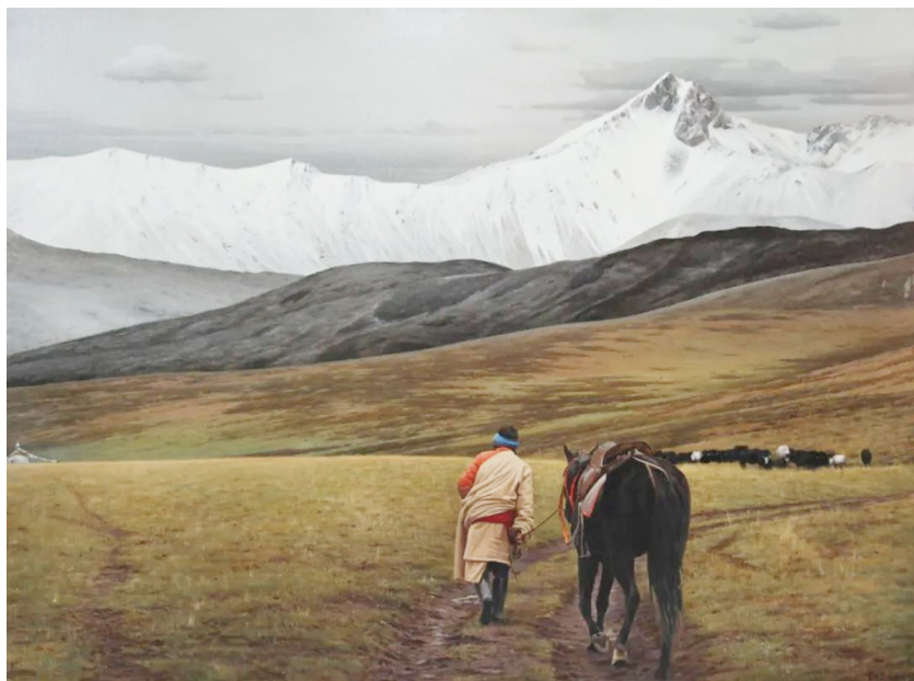
《远山》（油画） 曹自杰作（民革党员）