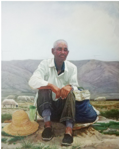
《守望》（油画） 委员、中国美术家协会会员） 杨升作（自治区政协