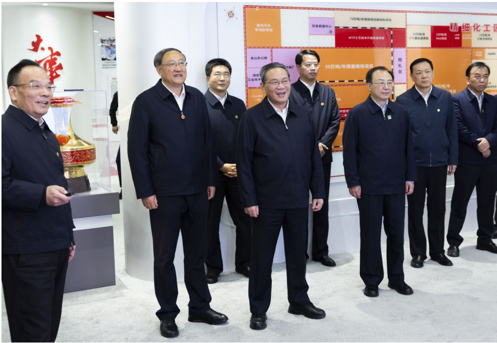
10月22日至24日，中共中央政治局常委、国务院总理李强在宁夏、内蒙古调研。这是10月22日，李强在宁夏银川国能宁煤公司煤制油项目区，了解现代煤化工发展情况。

新华社呼和浩特10月24日电 中共中央政治局常委、国务院总理李强10月22日至24日在宁夏、内蒙古调研。他强调，要深入贯彻落实习近平总书记关于生态环境保护和国家能源安全工作的重要指示精神，着眼国家战略和全局需要，坚持生态优先、绿色发展，立足资源禀赋、发挥特色优势，扎实推进“三北”防护林体系等重点生态工程建设，做好能源保供工作，为高质量发展提供有力保障。