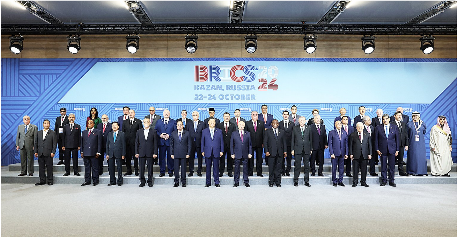
当地时间10月24日上午，国家主席习近平在喀山会展中心出席“金砖+”领导人对话会并发表题为《汇聚“全球南方”磅礴力量 共同推动构建人类命运共同体》的重要讲话。这是出席对话会的金砖国家及嘉宾国领导人或代表、国际组织负责人集体合影。

新华社俄罗斯喀山10月24日电 当地时间10月24日上午，国家主席习近平在喀山会展中心出席“金砖+”领导人对话会并发表题为《汇聚“全球南方”磅礴力量 共同推动构建人类命运共同体》的重要讲话。 习近平指出，全球南方群体性崛起，是世界大变局的鲜明标志。全球南方国家共同迈向现代化是世界历史上一件大事，也是人类文明进程中史无前例的壮举。同时，世界和平和发展仍面临严峻挑战，全球南方振兴之