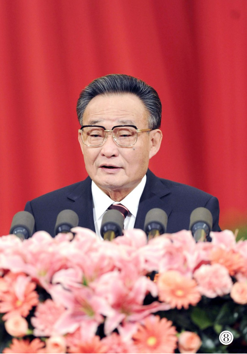
图⑧：二〇一一年三月十日，十一届全国人大四次会议在北京人民大会堂举行第二次全体会议。吴邦国同志作全国人民代表大会常务委员工作报告。新华社记者 谢环驰 摄