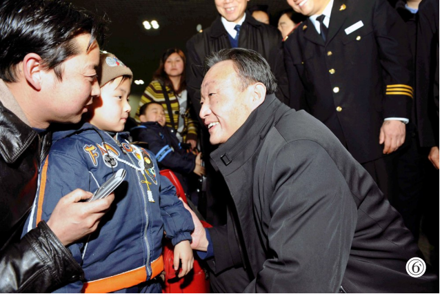
图⑥：2008年2月3日，吴邦国同志在北京西站候车室与旅客交谈。