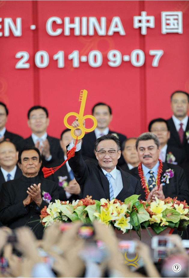
图⑨：二〇一一年九月七日，吴邦国同志在福建厦门出席第十五届中国国际投资贸易洽谈会开幕式。