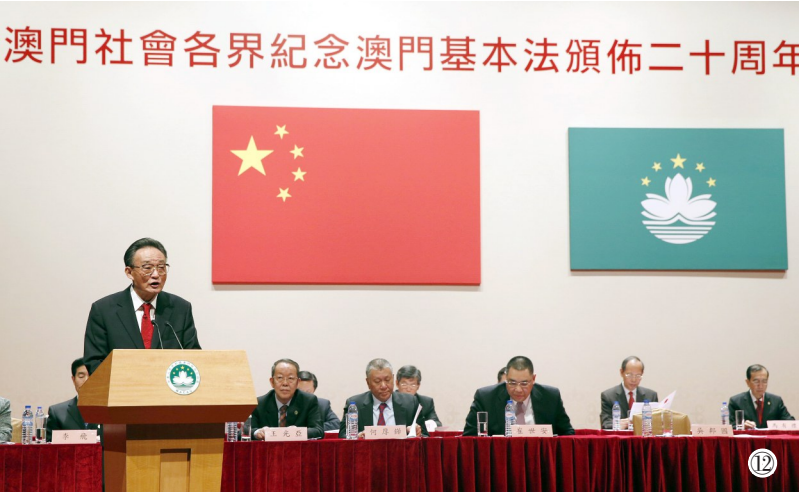
图⑫：2013年2月21日，吴邦国同志在澳门文化中心出席澳门社会各界纪念澳门基本法颁布20周年启动大会并发表讲话。