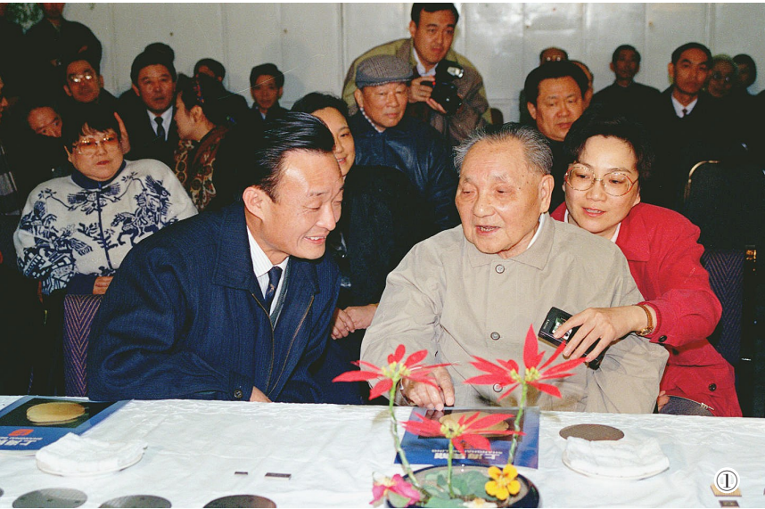
图①：1992年2月10日，邓小平同志在上海贝岭微电子制造有限公司参观时与吴邦国同志交谈。