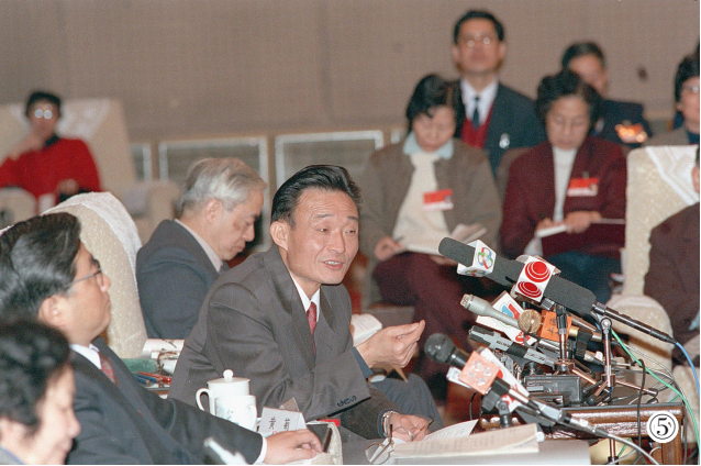
图⑤：1994年3月，时任上海市委书记的吴邦国同志在全国两会上海代表团全团会议上。