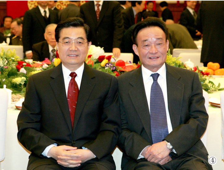
图④：二〇〇五年一月一日，全国政协在北京举行新年茶话会。这是胡锦涛同志与吴邦国同志在一起。