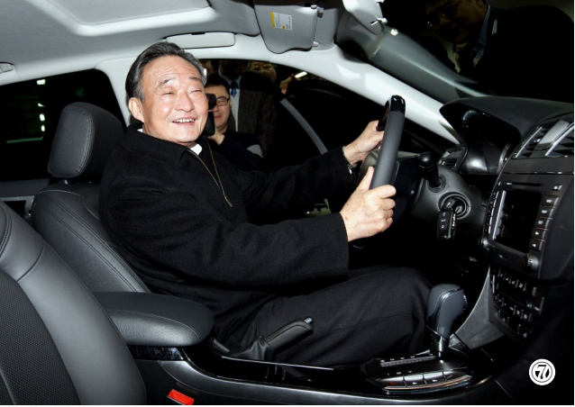
图⑦：2010年1月30日，吴邦国同志在上海汽车集团股份有限公司技术中心察看新能源样车。