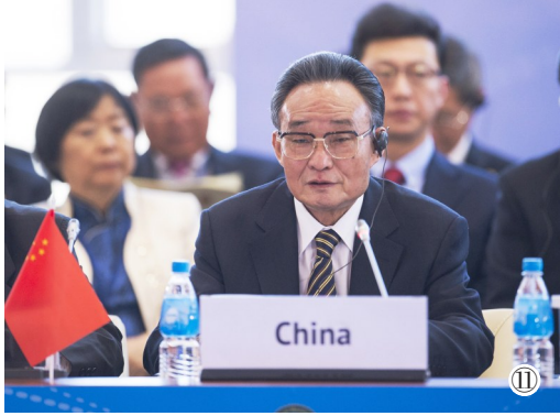
图⑪：2013年1月28日，吴邦国同志在俄罗斯符拉迪沃斯托克出席亚太议会论坛第21届年会，并作题为《坚持和平发展 促进合作共赢》的主旨发言。