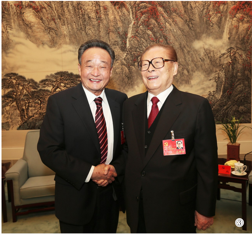
图③：2012年11月14日，中国共产党第十八次全国代表大会在北京闭幕。这是闭幕会前，江泽民同志与吴邦国同志在一起。