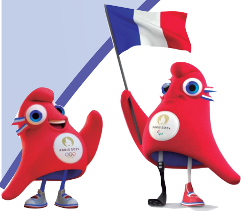
2024年巴黎奥运会吉祥物“弗里吉”。

每届奥运会不仅是各国运动员的竞技舞台,更是一场设计与创意相互碰撞的视觉盛宴。随着2024年巴黎奥运会的举办,全世界的目光都聚焦在这座充满艺术气息与历史沉淀的城市。“时尚之都”巴黎为世界呈现了一场别开生面的体育盛事,而本届奥运会在色彩、创意、概念上也不乏设计亮点,展现出独特的法式美学。