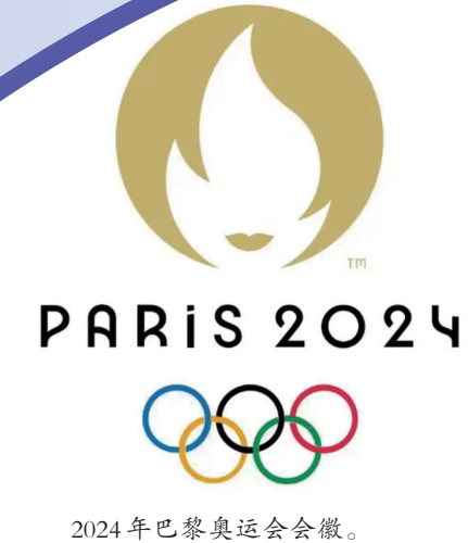
2024年巴黎奥运会会徽。

石板路一直是法国城市生活中的一大特色,从中世纪开始就已经在巴黎出现。随着19世纪交通系统的建立,石板路就变得更为普及。此次巴黎2024奥组