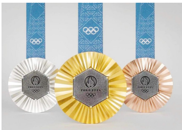
2024年巴黎奥运会奖牌正面。

2024年巴黎奥运会及残奥会的整体视觉设计在延续了平等、和平、美好愿望的同时,也通过设计回归到了为人造物的本质之上。