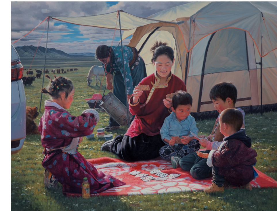
《格桑花开》（油画） 二〇二四年入选《全国第十四届美展》 曹自杰作（民革党员）