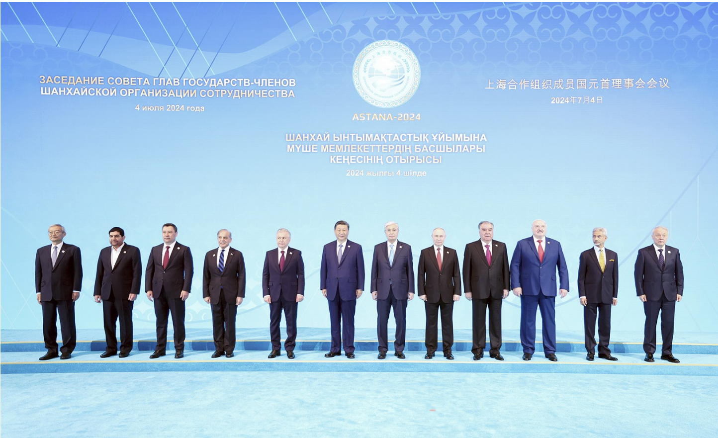
当地时间7月4日上午，国家主席习近平在阿斯塔纳独立宫出席上海合作组织成员国元首理事会第二十四次会议。这是习近平同上海合作组织成员国领导人集体合影。

新华社阿斯塔纳7月4日电 当地时间7月4日上午，国家主席习近平在阿斯塔纳独立宫出席上海合作组织成员国元首理事会第二十四次会议。 上海合作组织轮值主席国哈萨克斯坦总统托卡耶夫主持会议，上海合作组织成员国白俄罗斯总统卢卡申科、吉尔吉斯斯坦总统扎帕罗夫、巴基斯坦总理夏巴兹、俄罗斯总统普京、塔吉克斯坦总统拉赫蒙、乌兹别克斯坦总统