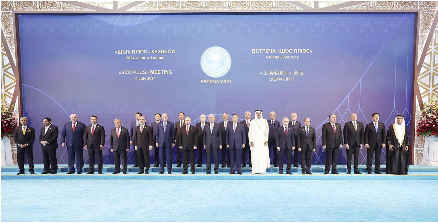
当地时间7月4日下午，国家主席习近平在阿斯塔纳出席“上海合作组织+”阿斯塔纳峰会并发表题为《携手构建更加美好的上海合作组织家园》的重要讲话。峰会开始前，习近平出席托卡耶夫为与会代表团团长举行的欢迎宴会并集体合影。

定为“上海合作组织可持续发展年”，愿同各方全面落实高质量共建“一带一路”八项行动，用好农业示范基地、地方经贸示范区、生态环保创新基地等平台促进区域合作。中方欢迎各