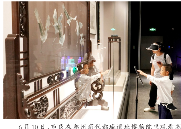
6月10日, 市民在郑州商代都城遗址博物院里观看苏州园林美学展上的展品。当日是端午节假期, 不少市民走进位于河南省郑州市的郑州商代都城遗址博物院, 观看在这里举办的苏州园林美学展, 通过百余件展品, 领略闲雅诗意的苏式生活。