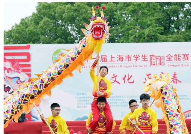
6月10日, 参赛选手在龙狮赛初中组的比赛中。当日, 第十一届上海市学生龙文化全能赛在东方绿舟开幕。本届赛事包括龙舟赛、风筝赛和龙狮赛, 设小学、初中、高中、高校四个组别, 吸引来自110多所学校的140多支队伍、共3300余名选手参赛。