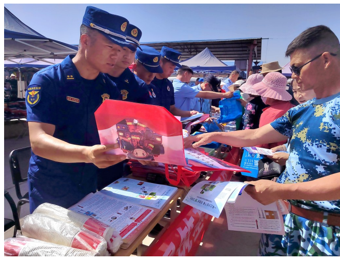
5月16日,在平罗县姚伏镇农贸市场集市上,平罗县消防救援大队宣传员向现场群众宣传消防知识。

为有效做好夏季火灾防控工作,提高广大农村居民抗御火灾能力、增强逃生自救能力,最大限度地预防和减少农村火灾事故发生,平罗县消防救援大队宣传员以“赶大集”的宣传形式,相继深入黄渠镇农贸市场、头闸镇农贸市场、姚伏镇农贸市场等5个集市开展“接地气”的消防宣传。