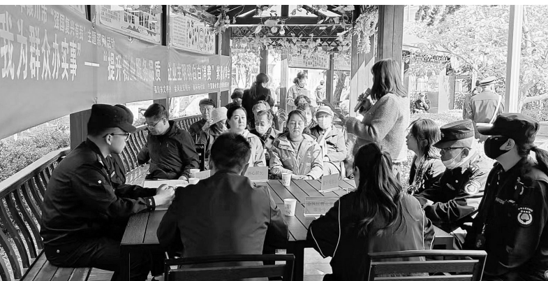
职能部门负责人共聚一堂协商交流。紫馨亭议事会现场，居民和各