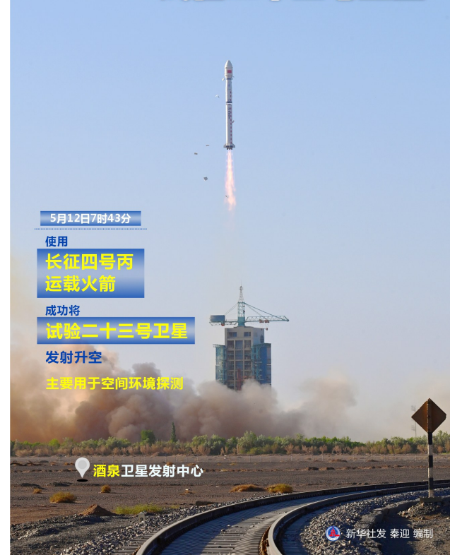
5月12日7时43分，长征四号丙运载火箭在酒泉卫星发射中心成功发射试验二十三号卫星。该卫星主要用于空间环境监测。