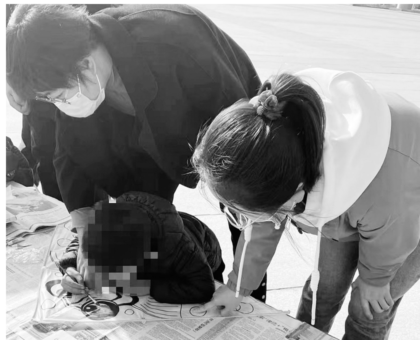
3月22日,石嘴山市残疾人康复中心组织在训儿童及家长开展“不负春光 童‘笋’绽放”为主题的教学活动,让幼儿充分体验到手绘画风筝及放风筝的乐趣,开阔了视野,有效增强家校合作,促进亲子交流,使家长对康复教育的观念有新的认识,促进幼儿社会性发展。本报记者 郝婧摄

残疾人的特殊困难和特殊需求,重点关注辖区内脱贫不稳定户、边缘易致贫户、低保户等特殊困难的残疾人家庭,全面走访摸排并建立台账,及时将其纳入帮扶对象,制定精准务实的帮扶措施。为让更多残疾人实现稳定增收,惠农区残联以“阳光助残小康计划”项目资金作为帮扶启动资金,每户投入4000元以每只羊1000元的价格购买4只羊入托,统一由专业养殖专业合作社进行规模化养殖,每年定期给养殖户进行分红。目前惠农区共有429户农村困难残疾人家庭享受到了“阳光助残小康计划”项目带来的红利。