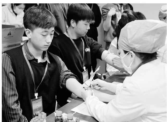
2月19日至20日,海原县组织应征青年在人民医院进行“一站式”体格检查,参检医生严格按照体检程序、方法和标准,仔细检查应征青年身体状况,为部队输送优质兵员把好“第一关”。

某,认真倾听其诉求,从情理出发,耐心对其释法说理,同时主动对王某启动司法救助程序,及时解决其现实困境。通过思想、生活两方面入手双线并行,解开了缠绕在王某心头的法结和心结。 2023年以来,永宁县检察院依托“五心解忧纾民困”工作品牌,通过司法救助、支持起诉、上门听证等多种方式,用心用情解决各类矛盾纠纷,着力保障和改善民生,促进社会公平正义,增进群众获得感、幸福感、安全感。今年,永宁县检察院将持续坚持和发展新时代“枫桥经验”,立足检察职能,转变工作理念,积极探索构建矛盾纠纷多元化解机制,以高质量检察履职积极融入社会治理大格局,为辖区和谐稳定贡献检察力量。