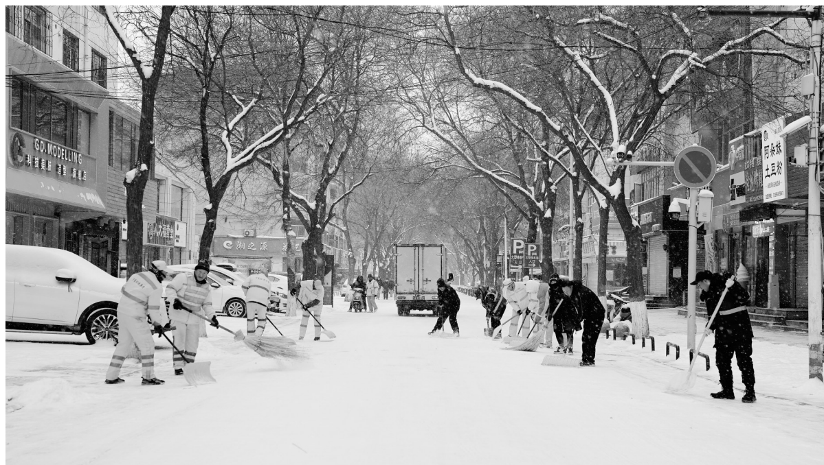
面对降雪天气,兴庆环卫以“雪”为令,紧急出动,顶着雪花、冒着严寒、昼夜奋战,为广大市民营造安全、洁净的出行环境。自降雪开始,宁夏环保集团城市服务有限公司兴庆分公司立即启动应急预案,累计派出1000余名环卫工人、8辆除雪车,采取“机械为主、人工为辅”的方式,持续投入到清雪工作中。

本报讯(记者 梁静) 2月21日,记者从银川市公交公司获悉,目前银川市三区两县及苏银产业园区域持续降雪,道路有积雪结冰情况,银川公交提早安排部署,研判降雪天气对运营安全造成的影响及风险,及时启动降雪天气运营保障应急预案。切实做到组织到位、人员到位、措施到位、多措并举确保公交线路运营秩序平稳有序。 21日凌晨4时起,银川市公交公司机关各室、所属各单位及维修车间应急保障小组人员共计600余人利用雪铲、铁锹、扫把等工具对各自分包场站路段进行清扫作业,启动悬挂大型清障车辆对BRT车道降雪进行清除。到线路沿线勘察道路积雪情况,做好安全情况监测、线路巡查和应急抢险救援工作。对上下车乘客宣传安全暖心提示,提醒乘客有序乘车、注意安全,主动搀扶行动不方便的乘客上下车。 对各场站的充电桩、基础安全设施,以及所有营运车辆的制动、灯光、转向、轮胎等关键部件进行全面排查,确保车辆性能安全可靠,应急抢修队时刻待命,备齐抢修物资和车辆,严格落实人员岗前“三查一询”制度,全力以赴保障公交线路正常运行。合理安排线路车辆运营,适时采取高峰时段加密班次、越站等措施,积极调配车辆,对BRT一号线、102路、107路、301路等34条公交线路加密128个班次,根据客流情况,灵活发车,确保市民安全出行。