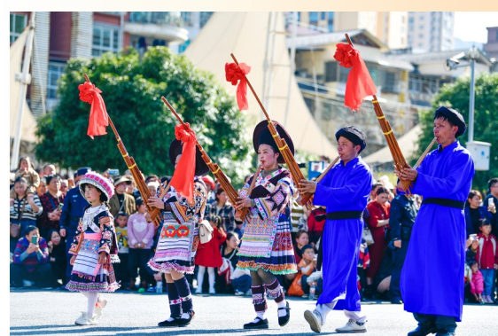
2月18日,人们在贵州省龙里县民俗踩街活动中跳芦笙舞。当日是正月初九,贵州省黔南布依族苗族自治州龙里县举办主题为“金龙贺岁·欢欢喜喜过龙年”的民俗踩街活动。