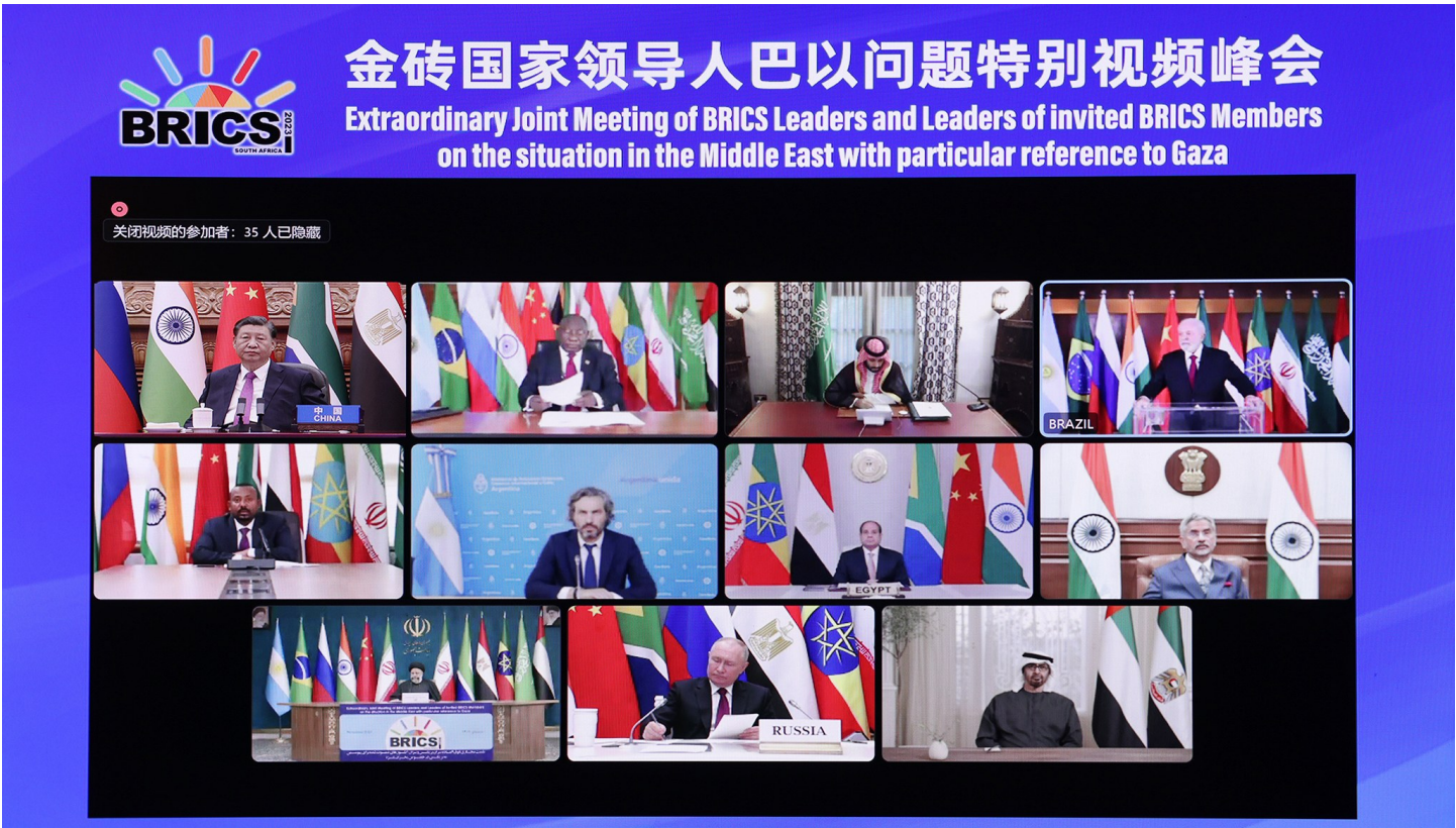
11月21日晚，国家主席习近平出席金砖国家领导人巴以问题特别视频峰会并发表题为《推动停火止战 实现持久和平安全》的重要讲话。

新华社北京 11 月 21 日电 11 月 21 日晚，国家主席习近平出席金砖国家领导人巴以问题特别视频峰会并发表题为《推动停火止战 实现持久和平安全》的重要讲话。 习近平指出，本次峰会是金砖扩员后的首场领导人会晤。当前形势下，金砖国家就巴以问题发出正义之声、和平之声，非常及时、非常必要。加沙地区的冲突已持续一个多月，造成大量平民伤亡和人道主义灾难，并出现扩大外溢趋势，中方深表关切。当务之急，一是冲突各方要立即停火止战，停止一切针对平民的暴力和袭击，释放被扣押平民，避免更为严重的生灵涂炭。二是要保障人道主义救援通道安全畅通，向加沙民众提供更多人道主义援助，