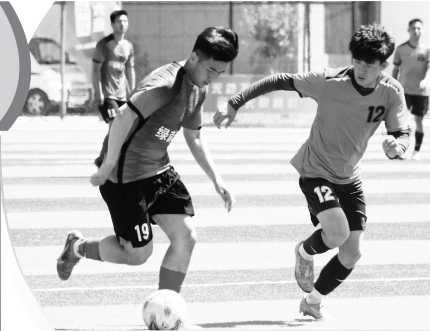
好发展。自治区体育局全力筹办自治区第十六届运动会等体育赛事,持续推进体育产业向优向强发展。

推动“体育+互联网”融合发展。统筹安排专项经费,完成了全区公共体育场馆运营试点任务,将全区大中型公共体育场馆有关数据接入国家体育总局全民健身服务信息平台,实现了健身人数统计上报、客流监测、赛事直播、体育赛事活动实时上传、远程预定健身场地等功能。挖掘山、沙、廊、岸、矿等区域特色资源,广泛开展独具特色的冰雪嘉年华系列活动、星空露营、“我的黄河徒步”“烽火长城”徒步穿越、“夜战生活节”夜跑等时尚消费引领性户外运动休闲项目,打造一景区一项目、一节会一活动、一产业一赛事。着力打造体育旅游“国字号”项目矩阵,组织各市、县(区)积极申报国家级体育旅游精品景区、赛事、线路、目的地和体育旅游示范基地项目,共获评22个“国字号”体育旅游项目。